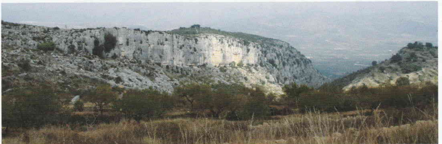
Figura 1. Farallón rocoso donde se abre el Abric del Barranc de les Calçades.

En su interior se conservan pinturas esquemáticas y levantinas. Los motivos esquemáticos se distribuyen principalmente en la parte central del abrigo, próximos a una colada. En una pequeña hornacina cuya superficie está muy alterada por la misma colada se observa una barra verti-