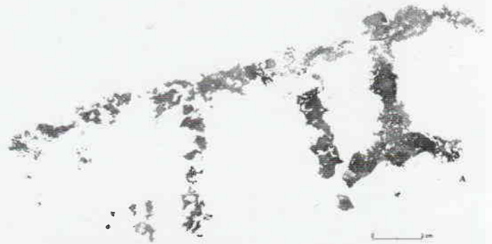
Figura 4. Calco de una representación antropomórfica acompañada de otro motivo de difícil interpretación (calco según los autores).