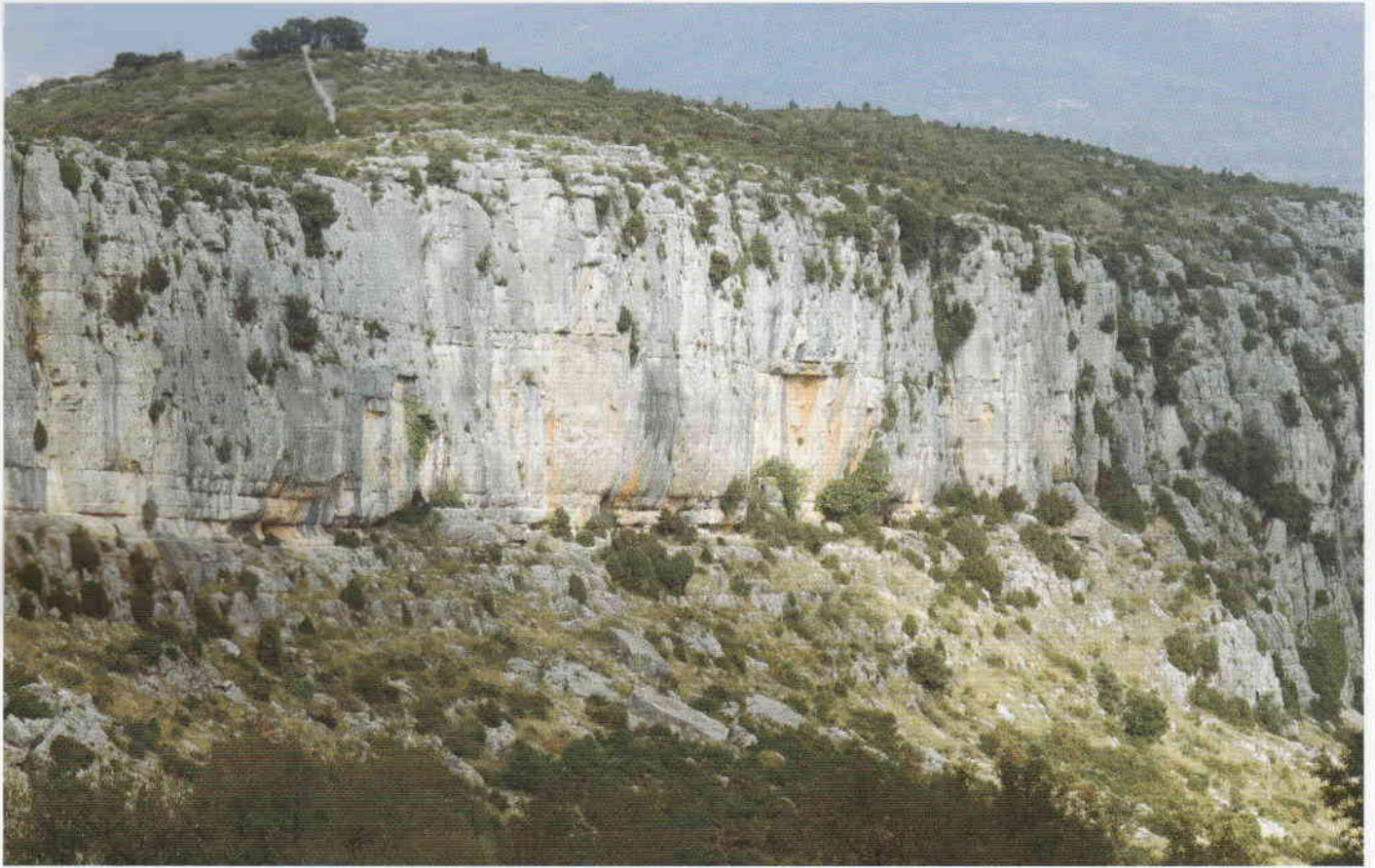
Figura 2. Abric del Barranc de les Calçades.

cal muy difuminada, con unos trazos en forma de arco en su extremo inferior que podrían corresponderse con las piernas de un antropomorfo. A la izquierda del mismo volvemos a encontrar una representación antropomórfica, de menores dimensiones (Figuras 3 y 4), realizada mediante una barra vertical, que da cuenta de la cabeza y el falo, y dos barras horizontales, en forma arqueada, que representan los brazos y las piernas. Justo debajo de esta última figura y ya fuera de la hornacina se ha ejecutado una representación antropomorfa de características similares, acompañada de una barra horizontal y al menos tres barras verticales. Hacia la izquierda y aislada de este panel se conserva una digitación. Estas figuras humanas encuentran sus paralelos formales más próximos en el Racó Molero (Ares del Maestre), aunque en este caso realizadas con pintura negra. En el extremo izquierdo del abrigo y prácticamente cubiertas por una colada estalagmítica se conservan varias figuras humanas de estilo levantino. Una de ellas, es un arquero de muy reducido tamaño, del que sólo se observan las piernas, modeladas en las pantorrillas y con indicación de los pies. La otra figura conserva la cabeza, los brazos flexionados hacia abajo y una línea vertical que podría corresponder a una flecha. Debajo de este antropomorfo hay restos de pigmento.