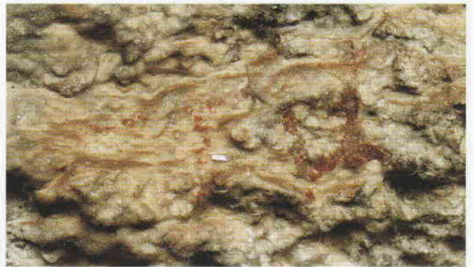
Figura 3. Detalle de uno de los motivos esquemáticos del Abric del Barranc de les Calçades.

Bibliografía: Martínez Valle, R., et al. (2008).