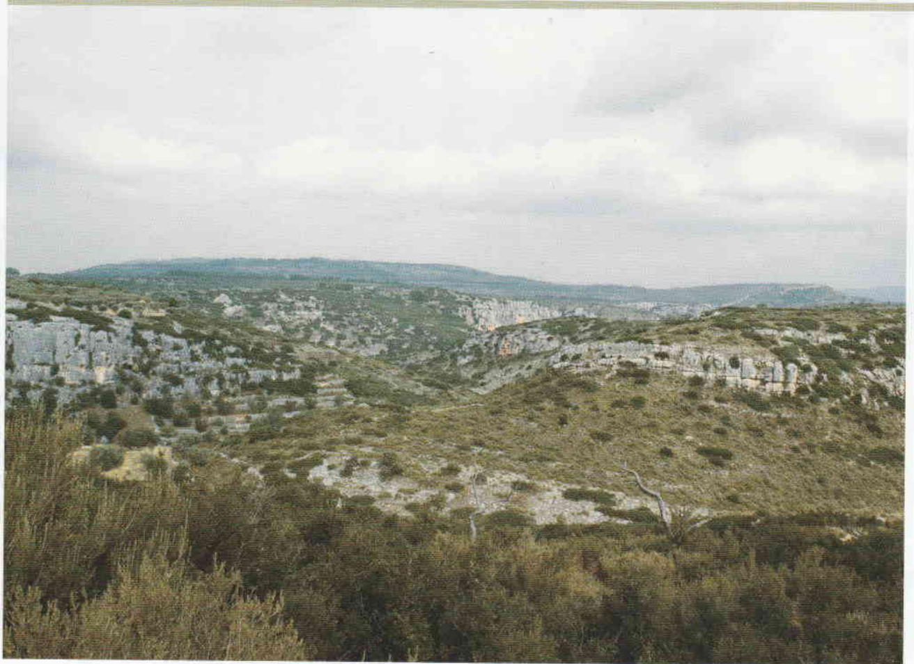
Figura 1. Farallón rocoso del Barranc Fondo donde queda ubicado el abrigo.