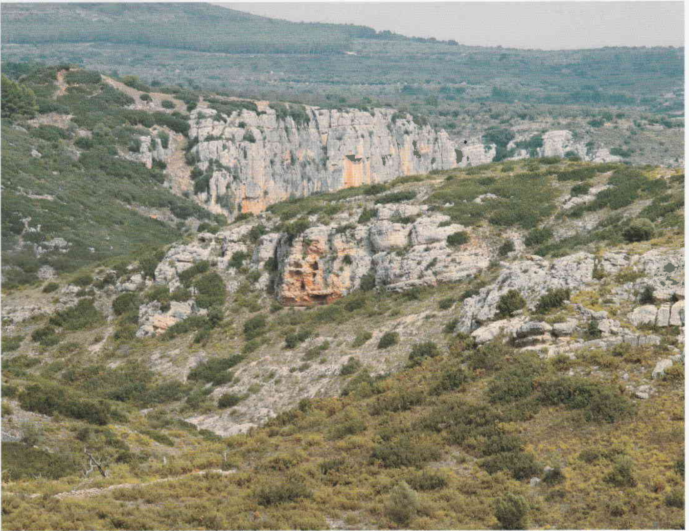
Figura 2. El Abric del Barranc Fondo.