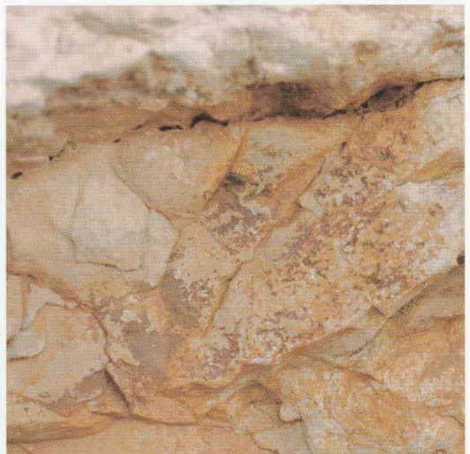
Figura 3. Restos de pigmento de color rojo.