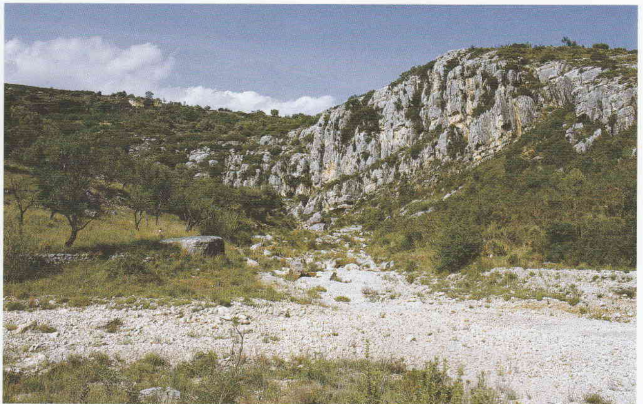
Figura 1. La Roca del Migdia se localiza en la margen izquierda de la Rambla de la Morellana cerca de la confluencia con el Barranc Fondo.