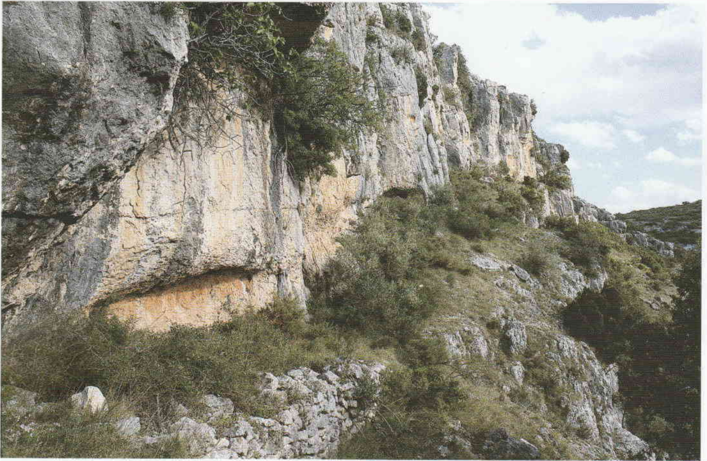
Figura 2. El abrigo es de pequeñas dimensiones y está acompañado de otras cavidades dispuestas en sentido ascendente.