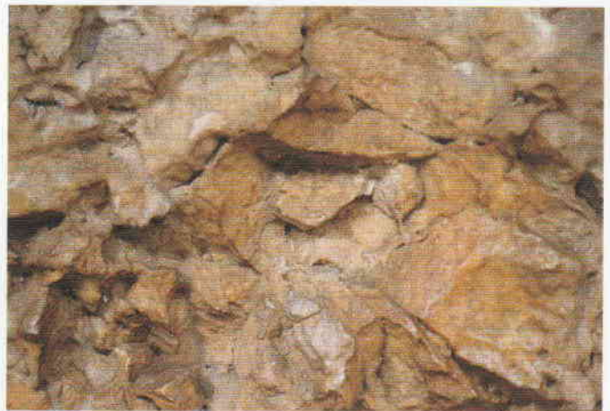
Figura 3. Manchas de pintura junto a una oquedad natural.