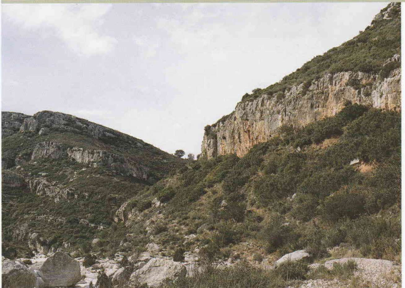
Figura 1. Paisaje de los alrededores del Cingle dels Tolls del Puntal.