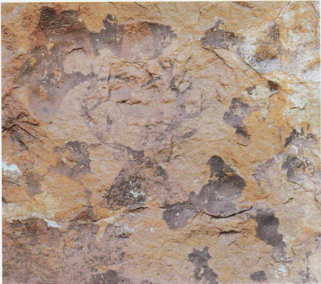
Figura 4. Ciervo y restos de figuras humanas de la segunda cavidad.