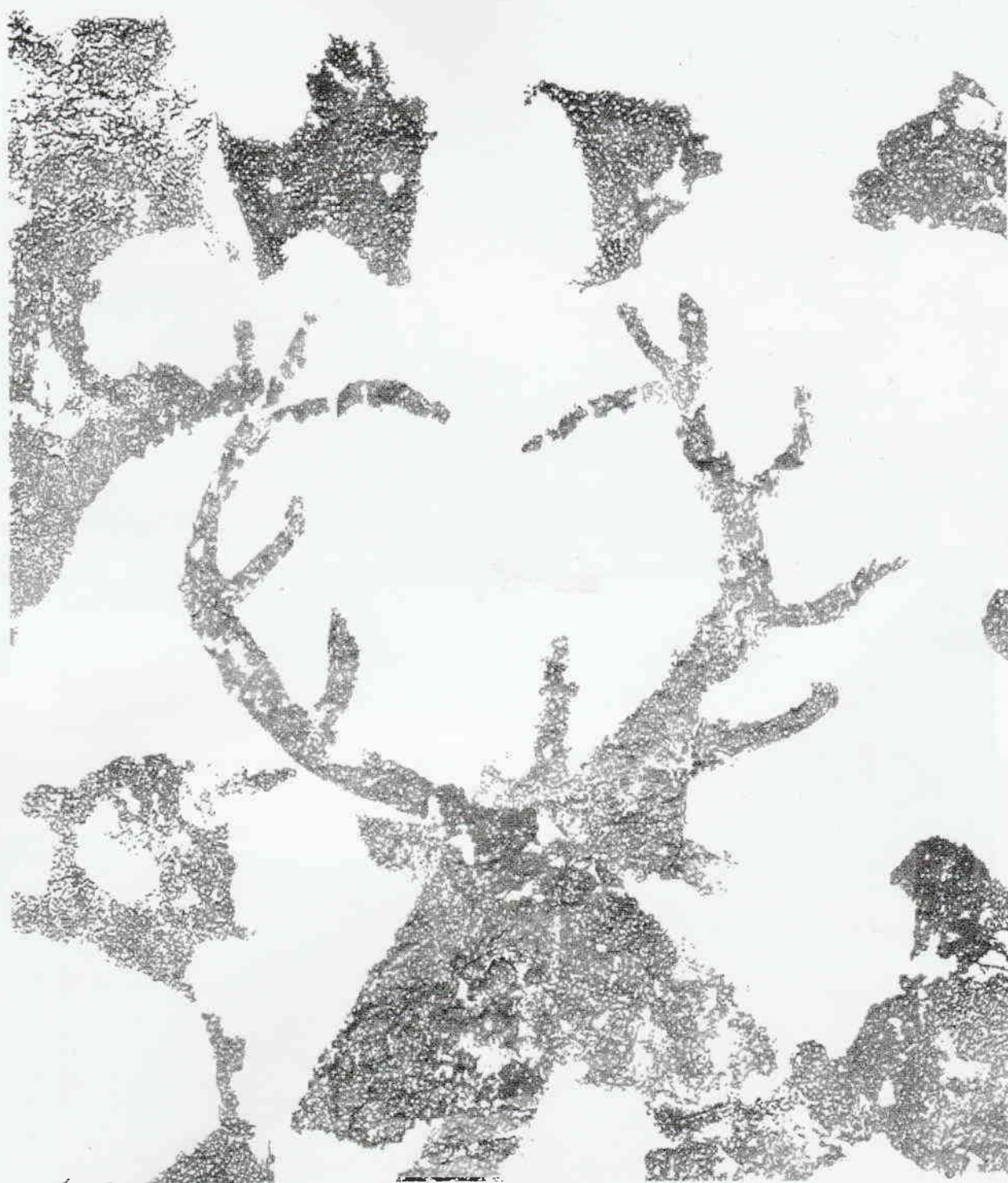
Figura 5 Calco del ciervo y restos de figuras humanas (calco según los autores).