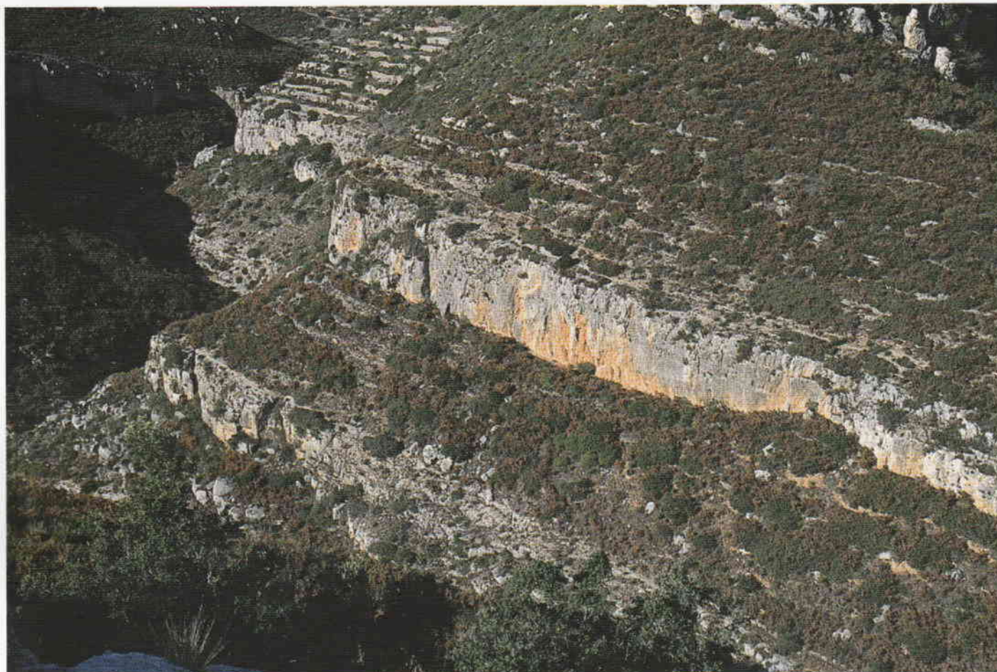
Figura 2. El abrigo del Cingle dels Tolls del Puntal.