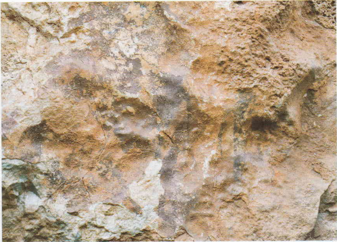
Figura 3. Figuras humanas de la primera cavidad.