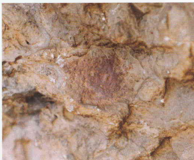
Figura 3. Motivo de tendencia circular.

Bibliografía: Martínez Valle, R. et al. , (2008).