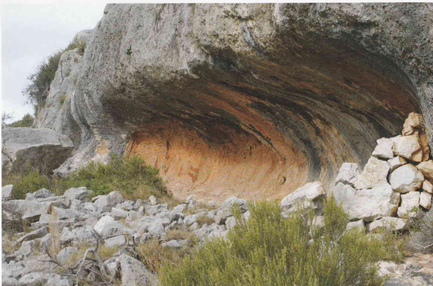
Figura 2. El Abric del Mas d'Abad.