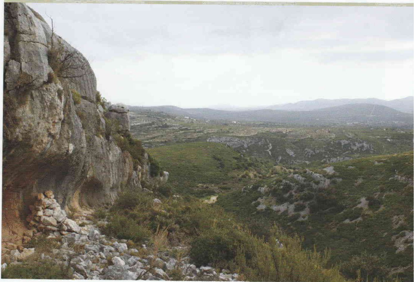
Figura 1. Paisaje del Abric del Mas d'Abad.