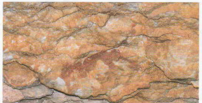
Figura 4. Zoomorfo.