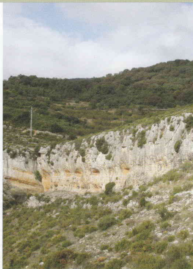
Figura 1. Localización del abrigo del Mas de Custodi.

En los dos abrigos siguientes no hemos observado ninguna manifestación artística. En el cuarto abrigo tenemos dos cavidades. En la primera y en una posición central se observan trazos de color rojo que corresponden a la figura de un arquero de estilo levantino orientado a la izquierda (Figura 3). Del mismo se conserva parte de la cabeza, los brazos lineales y dispuestos en forma de arco, parte del cuerpo y las piernas, que parecen estar abiertas indicando movimiento. Con una de sus manos sujeta el arco y las flechas. A su de-