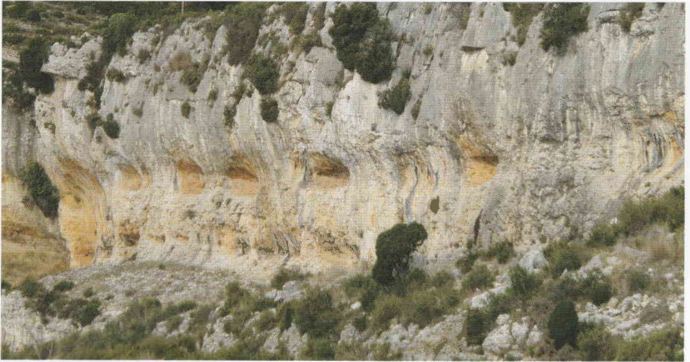
Figura 2. Abrigo del Mas de Custodi.