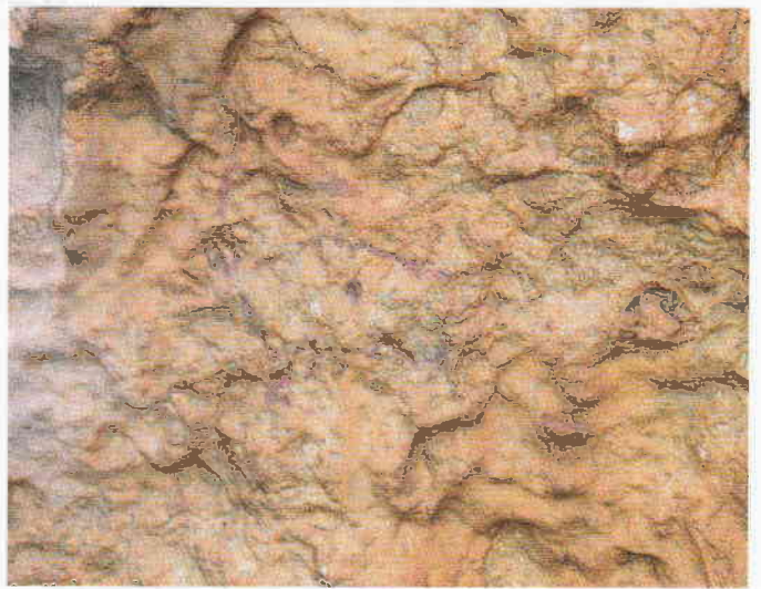
Figura 3. Arquero orientado hacia la izquierda.

Bibliografía: Martínez Valle, R. y Guillem, P. M., (2008).