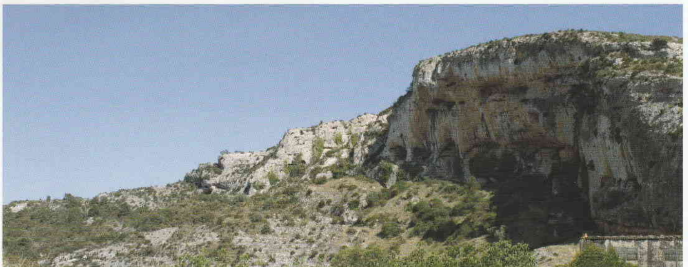
Figura 1. La Moreria de Les Coves de Vinromà.

La primera de ellas es una pequeña covacha de desarrollo horizontal (Figura 2). Los motivos se pintaron en la misma entrada, a su izquierda, y en una posición superior. Las pinturas se aprecian con dificultad al estar lige-