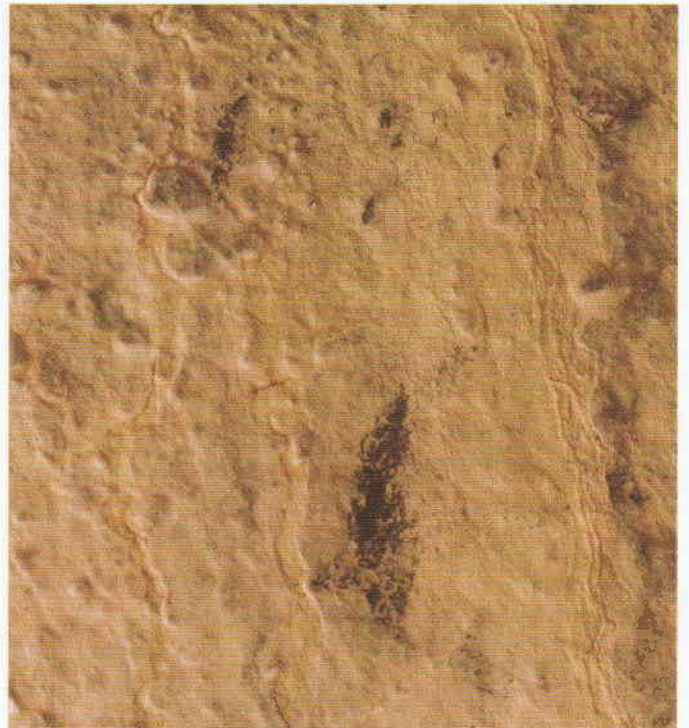
Figura 3. Los motivos pintados de color negro.