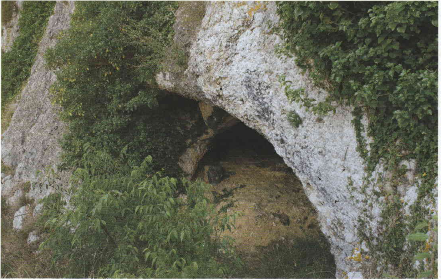
Figura 2. El abrigo donde se ubican los motivos pintados de la Coveta Juliana de la Moreria.

ramente cubiertas por una veladura de carbonato cálcico y erosionadas por la misma actividad cárstica.