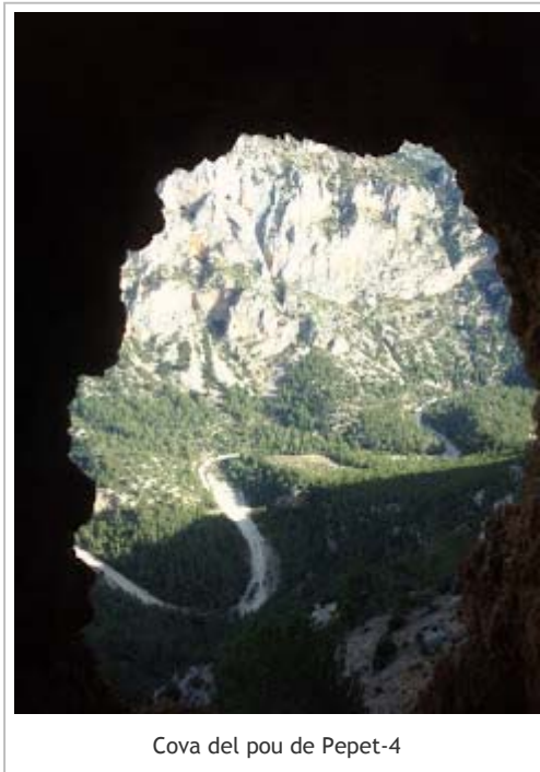
Cova del pou de Pepet-4

Pels Voltants hi ha una ombria en la part alta del Morralàs, que formava un racó sobre els 900 metres d'alçada, ací es va observar una vegetació digna d'estudi ja que algunes de les espècies vegetals vistes: pi roig, pinassa, auró, savina rastrera, savina, coixí de monja, guillomo, roure, etc, además de moltes espècies rupícoles no son molt usuals en aquestes alçades.