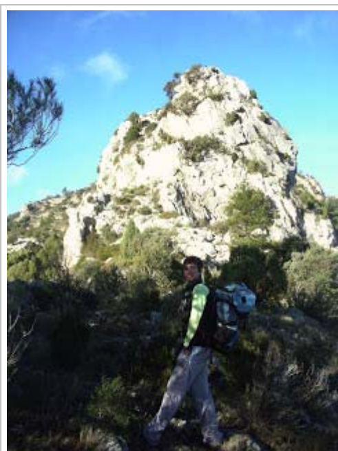
En el Castellet del Mas de Marin