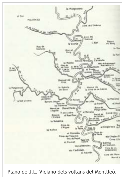
Plano de J.L. Viciano dels voltans del Montlleó.

Es de destacar la gran quantitat de cabres salvatges que eixien al nostre pas i s'estranyaven de la nostra presència per aquelles brenyes i sargallars.