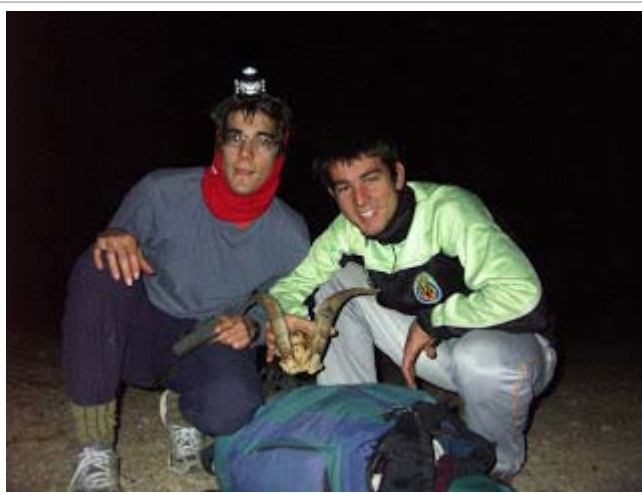
Arribada a l'Ortisella

L'absència de persones que informen sobre el terreny no ens ha permès localitzar més coves ni averiguar els topònims de les 15 cavitats explorades a terme de Benafigos.