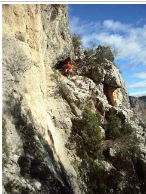
Boca del possible forat del Lladre-2

En el mateix racó trobem penjada altra cavitat erosiva, de forma tubular amb 16 metres de galeria, que a pesar de trobar-se alta sobre el tallat allí dins hi havien restes de excrement de cabra.