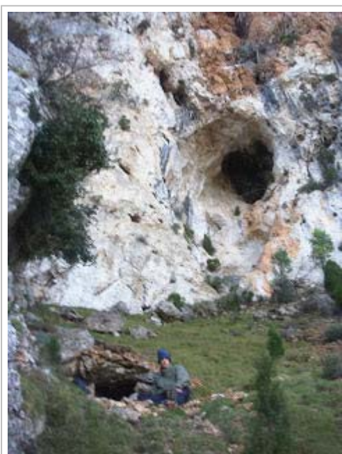
Pou de Pepet i al fons la cova n°1

cingles Fondos, Verd i de Peña Calba formen les seues delícies per estar tranquils i entretinguts en les cabres.