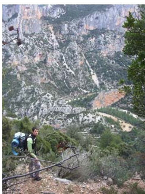
Vista desde la zona estudiada

Continuant pel tallat sols vam observar algun abric poc fondo o paret de pedra en sec baix del cingle de poca importància. El finalitzar el tallat venia alguna barrancada on vam descendir i ens vam acostar a el possible Racó Fosc, inici de un barranc rodejat de cingles on no vam trobar cap indici de cova, encara que baixant per la tartera prop d'uns farallons vam localitzar una petita cavitat de 9 metres sense interès espeleològic.