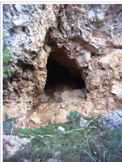
Cova del pou de Pepet-2

Seguin el Cingle vam fer punta al inhòspit Pou de Pepet, que encara conserva les construccions antigues, on comença una seguida de cavitats juntes, on es troba la Cova del Fogueral, i altres mes, anomenades per nosaltres Cova del Pou de Pepet- 1, 2, 3 i 4 de recorregut subterrani entre 4 i 30 m., totes elles explorades i topografiades.