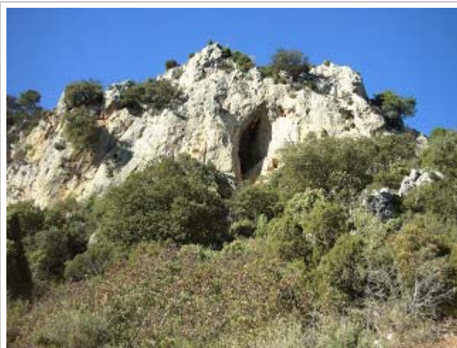
Boca del forat de la Sobalma

El següent dia sobre les 9h topografiarem la cavitat i proseguirem la prospecció. En les proximitats es trobà una cova que tenia un pont de roca, la nomenem Cova Foradà, de 13 metres de recorregut, en la qual vam ser sorpresos per la crida de Culla (bando) amb una cançó de ball tradicional que s'escoltava ressonant fortament en el vall del Riu Montlleó creant una sensació estranya però a la vegada de festa. Continuant no massa vam arribar a un abric amb fogueral per al pastor i tanca menuda per al ramat, segurament siga la nomenada en el plano de Viciano com a la Sobalma, i en les proximitats del tallat penjada a quasi 10 metres un gran forat, nomenat per nosaltres com a Forat de la Sobalma.