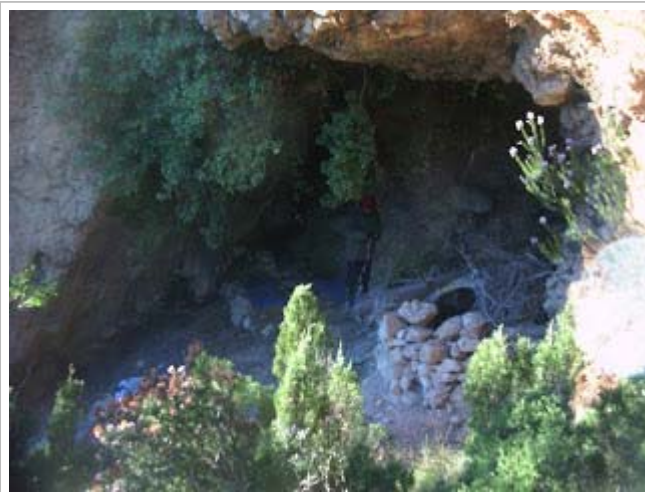
Cova de l'Aigua, pel matí.

El següent dia sobre les 9h topografiarem la cavitat i proseguirem la prospecció. En les proximitats es trobà una cova que tenia un pont de roca, la nomenem Cova Foradà, de 13 metres de recorregut, en la qual vam ser sorpresos per la crida de Culla (bando) amb una cançó de ball tradicional que s'escoltava ressonant fortament en el vall del Riu Montlleó creant una sensació estranya però a la vegada de festa. Continuant no massa vam arribar a un abric amb fogueral per al pastor i tanca menuda per al ramat, segurament siga la nomenada en el plano de Viciano com a la Sobalma, i en les proximitats del tallat penjada a quasi 10 metres un gran forat, nomenat per nosaltres com a Forat de la Sobalma.