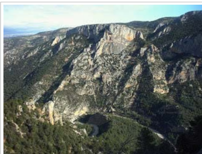
Territori on viuen les cabres, al fons la Penyalcalba.

En els primers dies de l'any i aprofitant les vacances del Nadal, dos membres actius de l'Espeleo Club Castelló mamprengeren de valent una ruta que sols acostumen a fer les cabres salvatges que deambulen al seu parèixer.