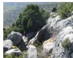
AVENC DEL MAS DE PAUL