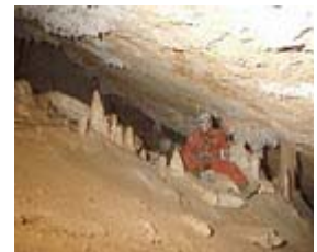
AVENC DEL TURIO - I