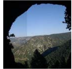
Vistabella del Maestrat