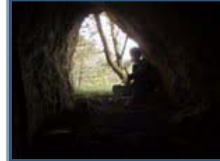
COVA DEL MAS DE MONÇO (VISTABELLA)