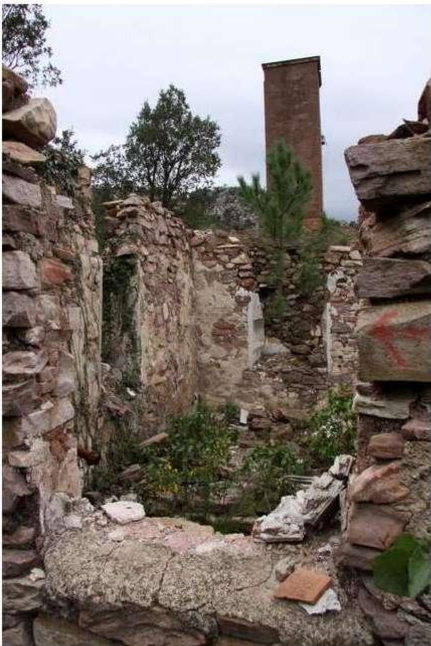
Caseta del compresor