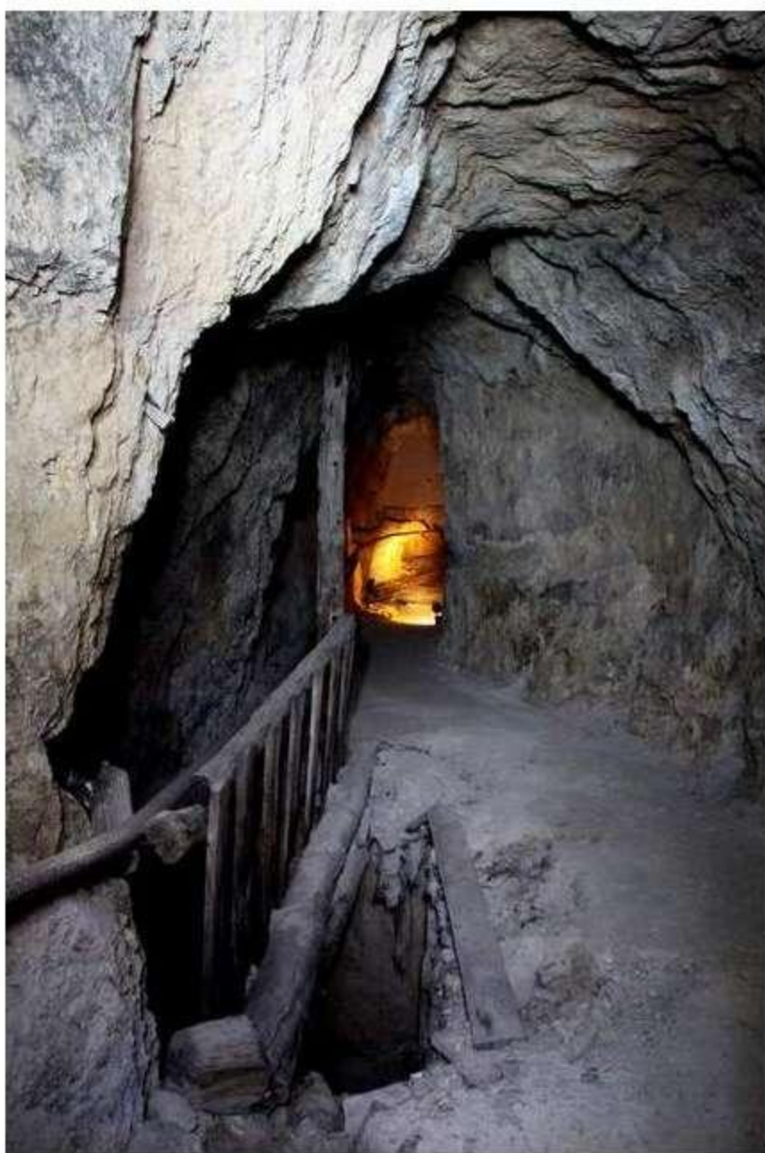
Contrapozo protegido