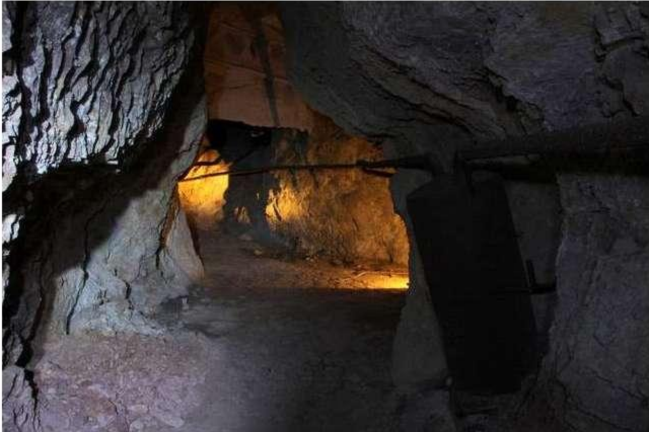
Calderín de aire comprimido en galería