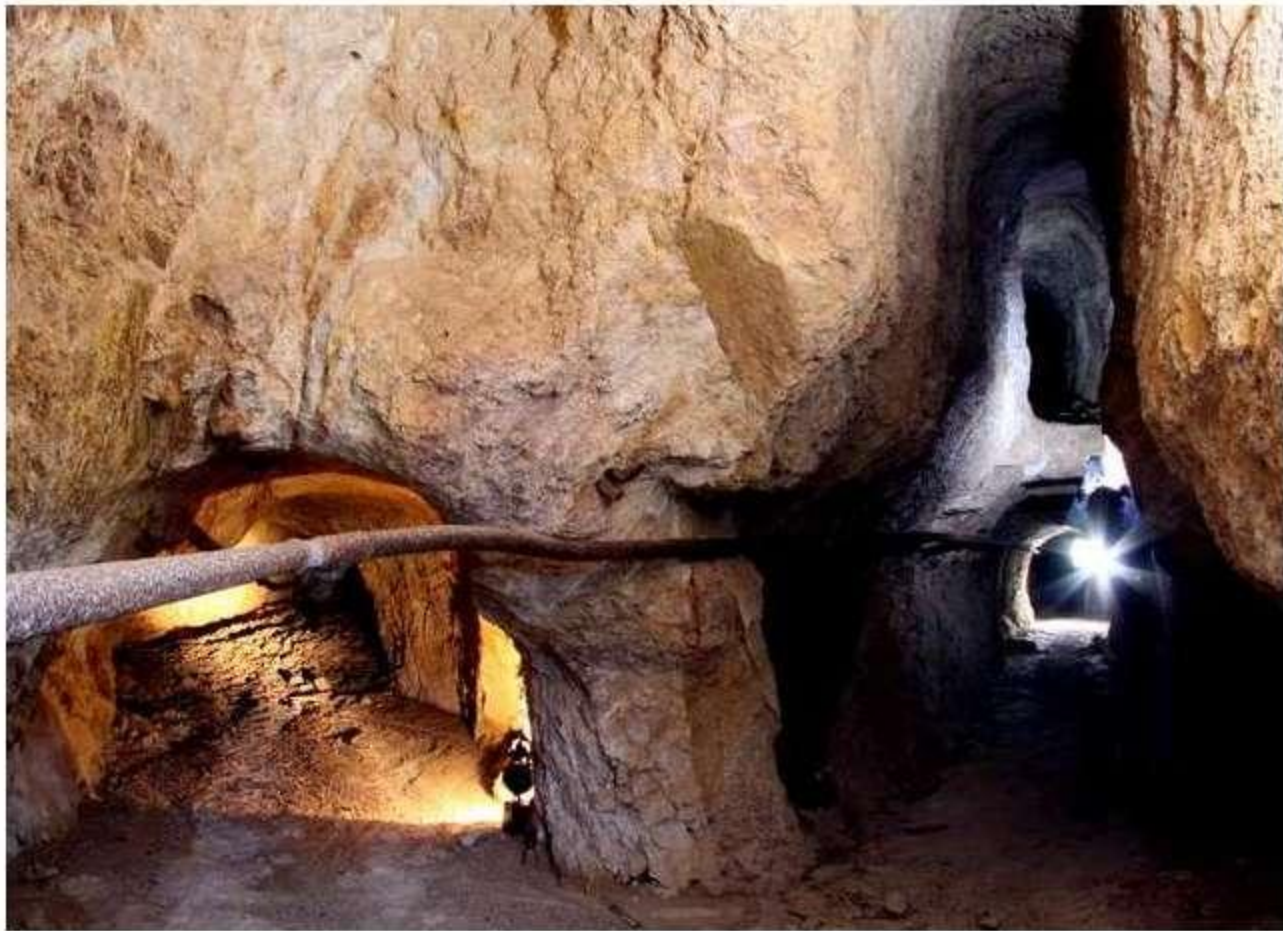
Galerías a distintos niveles