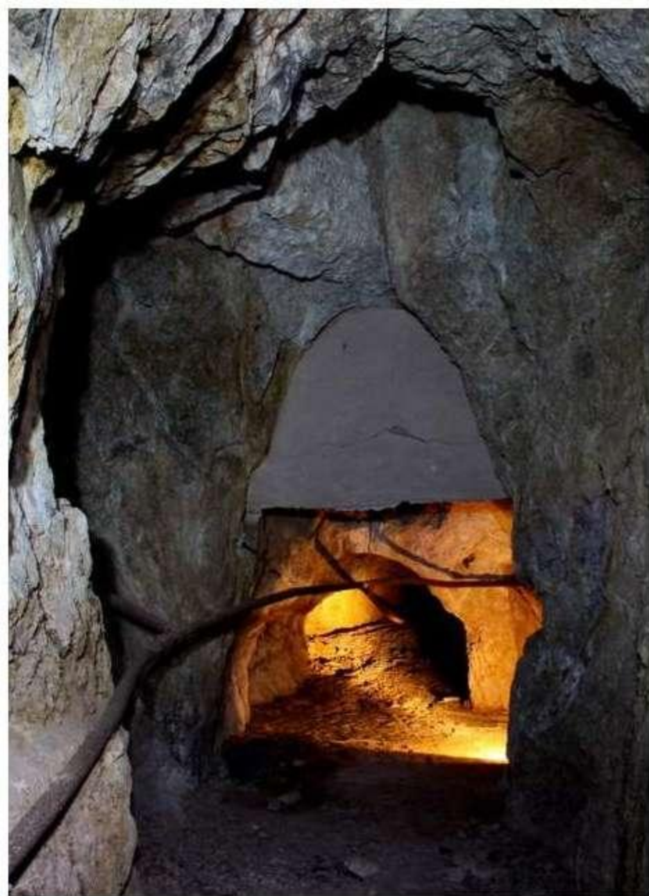
Compuerta de ventilación