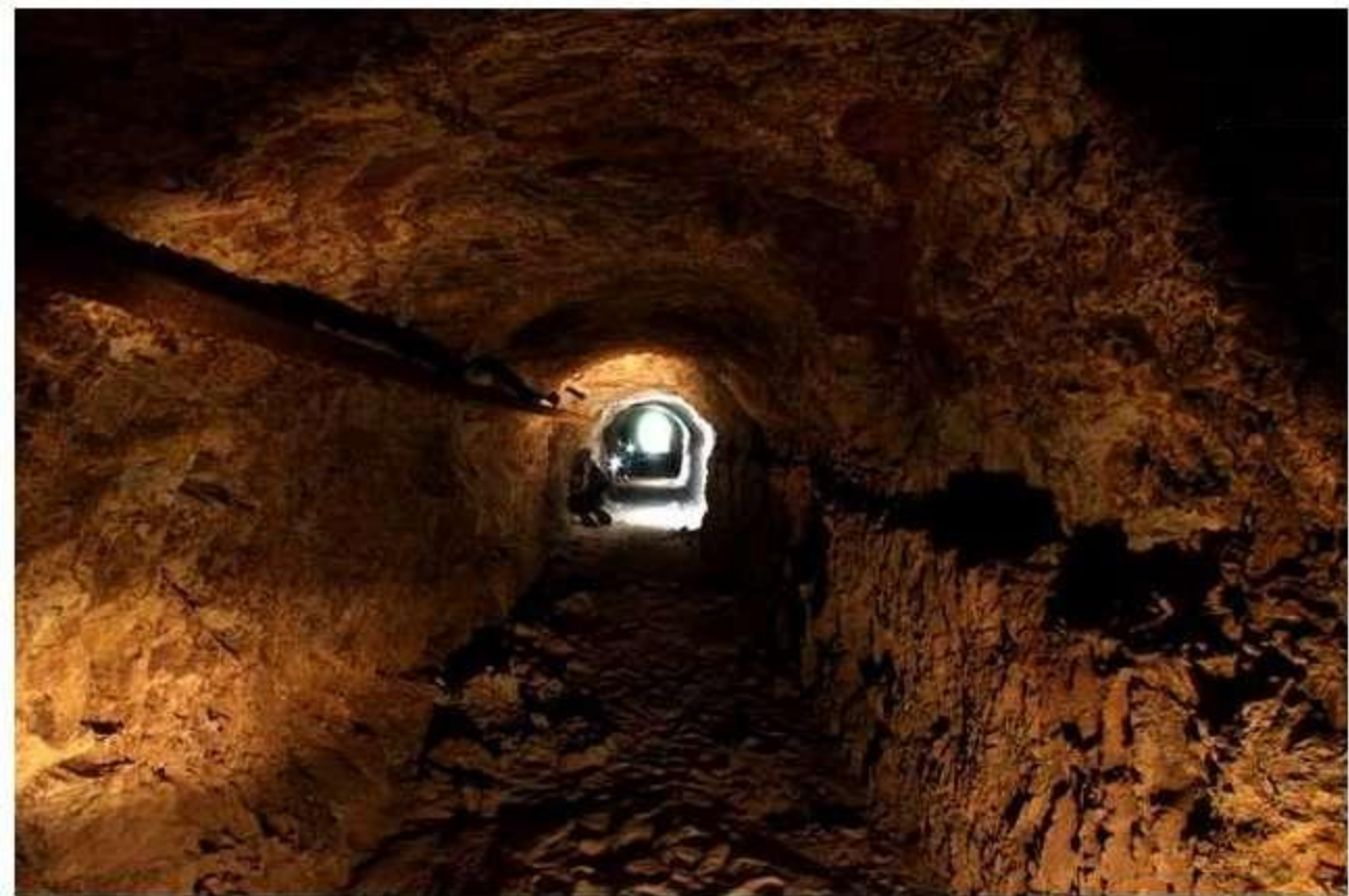
Galería principal