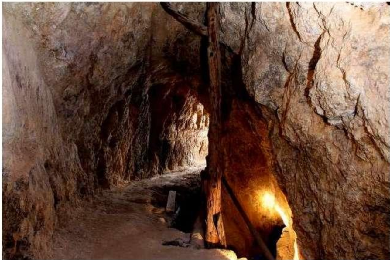
Contrapozo y acceso a labores inferiores (Fot. J.M. Sanchis, 2009)