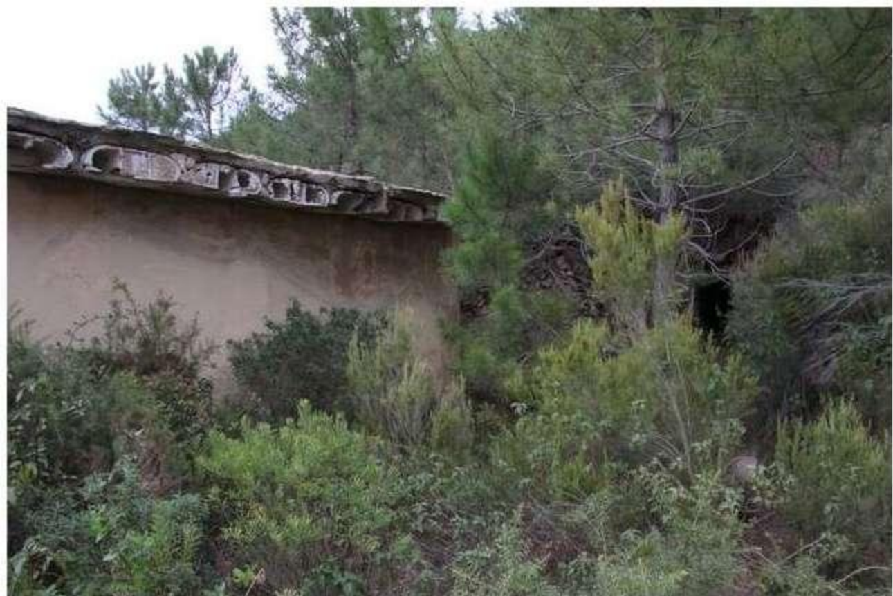
Acceso a la galería Diana