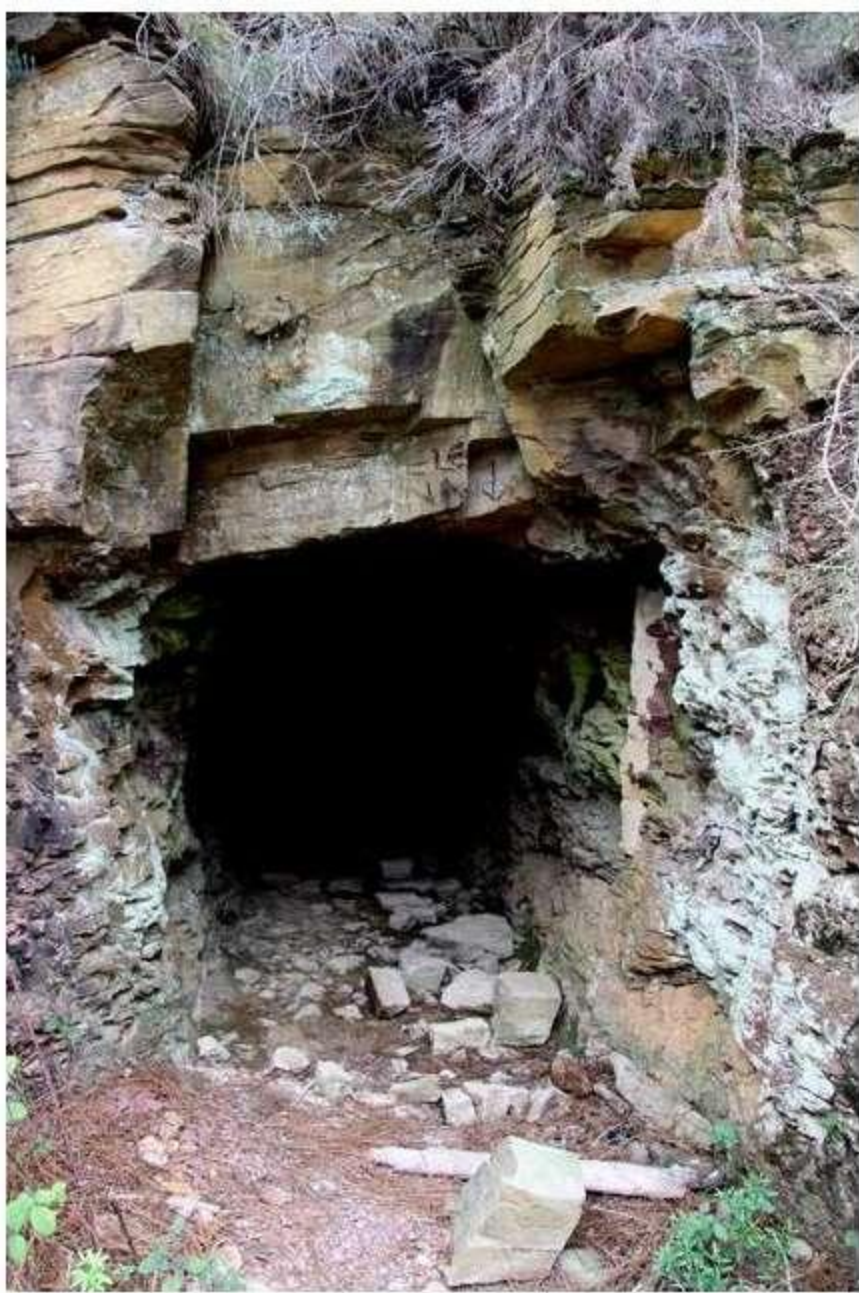
Entrada a la galería Diana (Fot. J.M. Sanchis, 2009)