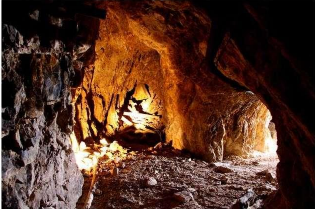
Bifurcación de galerías (Fot. J.M. Sanchis, 2009)