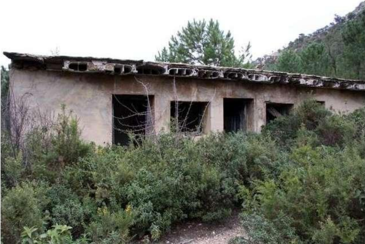
Casa de la mina