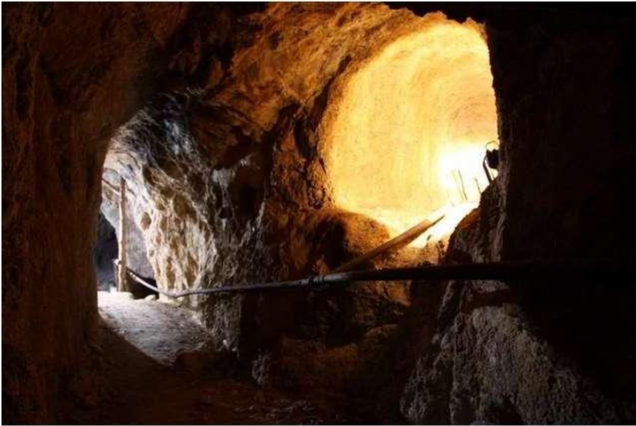
Galería a pozo de ventilación. Al fondo, contrapozo (Fot. J.M. Sanchis, 2009)