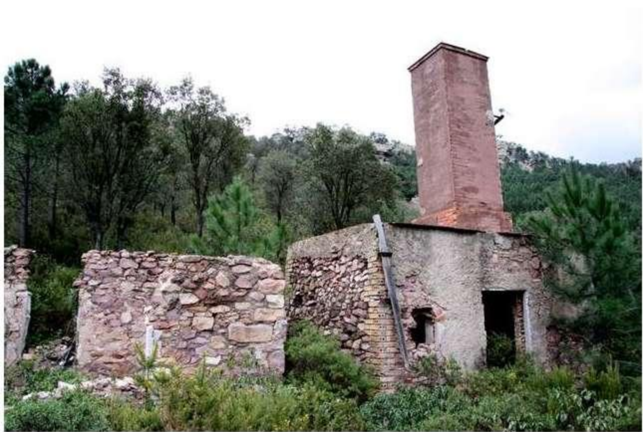
Instalaciones del transformador (Fot. J.M. Sanchis, 2009)