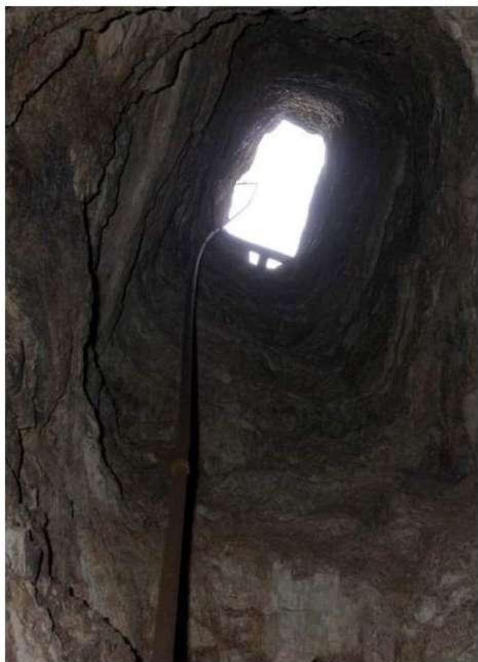
Pozo de ventilación, visto desde su base