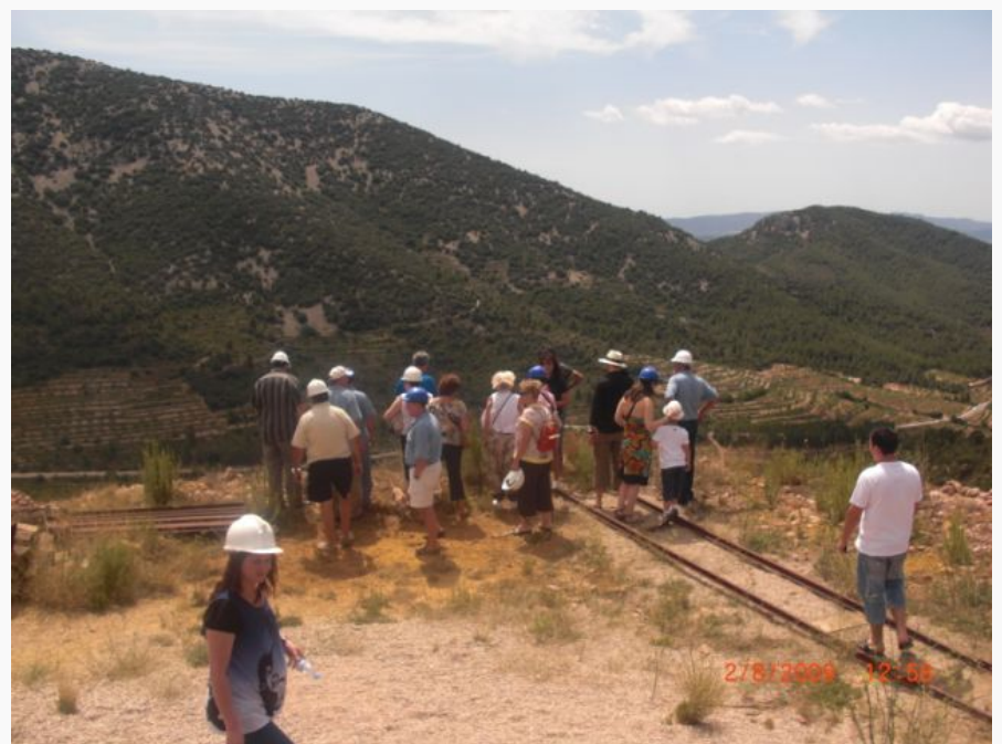
Carriles al vertedero, Foto : Miguel Bernat Armiño