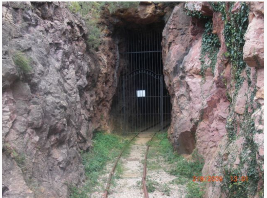
Bocamina, en minas de Culla

El material móvil con que cuenta actualmente la mina, se reduce a dos vagonetas de vuelco para mineral, tipo Decauville y un tractor Ruston cedidos por la Asociación para la Preservación Industrial , de Castellón. Dicho material procede de una donación de la Compañía Española del Gas, procedente de los gasógenos de Valencia, cuya utilización dentro de la factoría