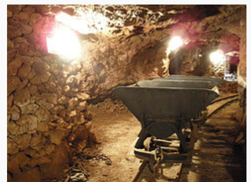
Interior de la mina de Nueva Victoria, foto: Miguel Bernat Armiño