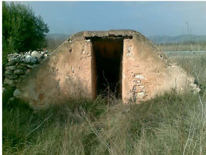
Refugi antiaeri.