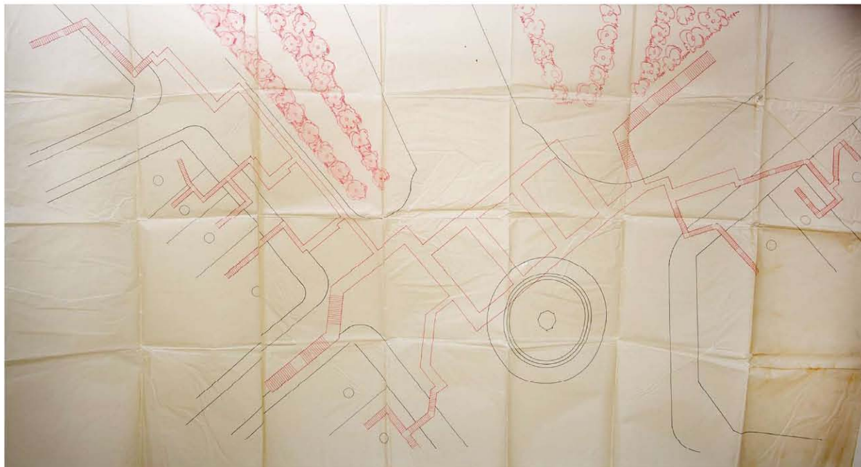
Plànol del refugi subterrani sota la farola