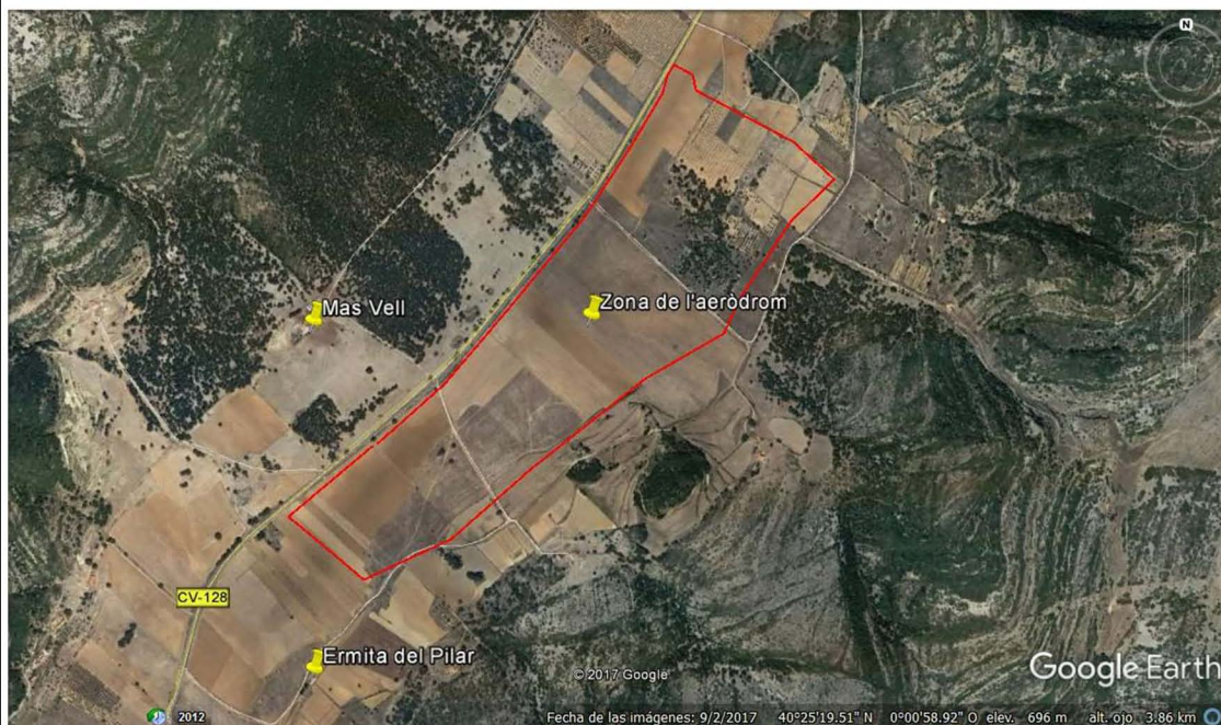
Ubicació de l'aeròdrom republicà de Catí