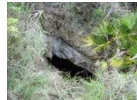
AVENC MÁXIM - Artana