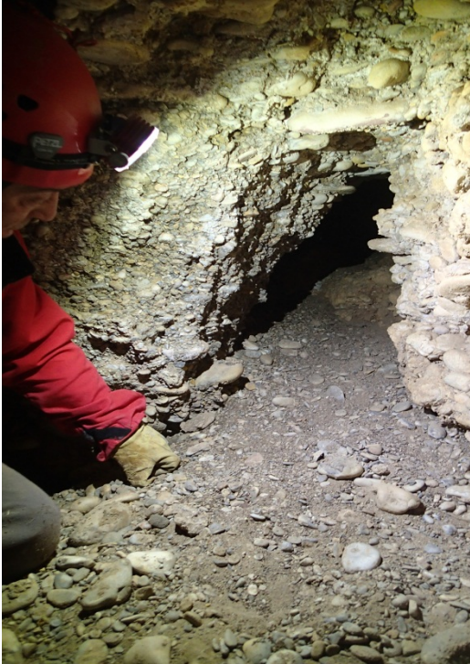
GALERIA DE 7 m de long. Y 29 cm DE ALTURA MAXIMA

como realizar un levantamiento topográfico de la parte subterránea utilizando técnicas e instrumentos de última generación y una exploración a fondo de las zonas más angostas de la cavidad.