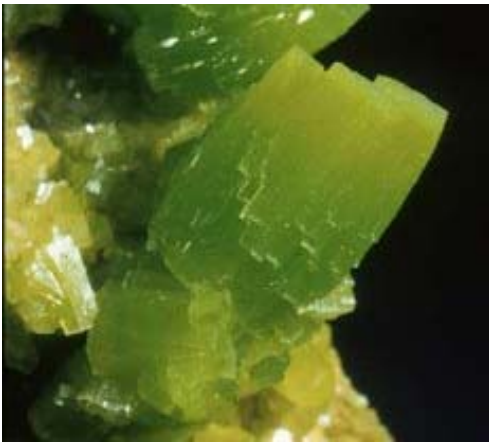
Piromorfita. Mina San Andrés, Espiel, Córdoba

explotado por la Spanish Mining Syndicate, con pésimos resultados.