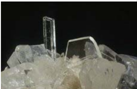
Yeso. Alcanadre, La Rioja

Se accede a ella por una angosta pista que parte desde la carretera de La Vall a Segorbe (CV-230), y antes de atravesar el puente del barranco de Cerverola. A unos dos kilómetros, y justo donde la pista se abre en una replaza para poder maniobrar, se encuentran las labores, al fondo del barranco.