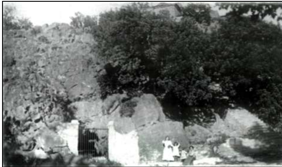
Imatge antiga de l'entrada a la cova

En 1929 va morir un veí de la Vall a l'intentar superar la "Galeria dels Sifons". Durant els anys 50 i 60 es van descobrir noves galeries. Entre els anys 60 i 70 s'efectuen diversos intents d'exploració subaquàtica. Finalment durant els anys 90 es faran els estudis més exhaustius de la font.