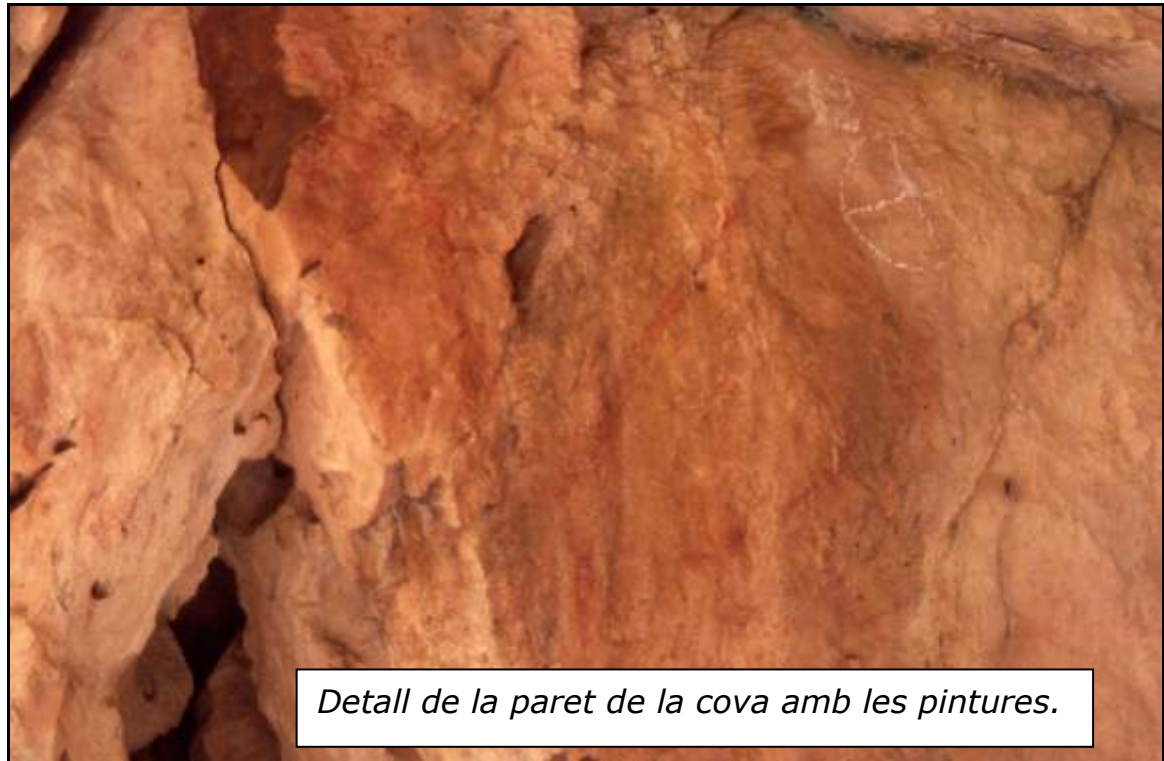
Detall de la paret de la cova amb les pintures.