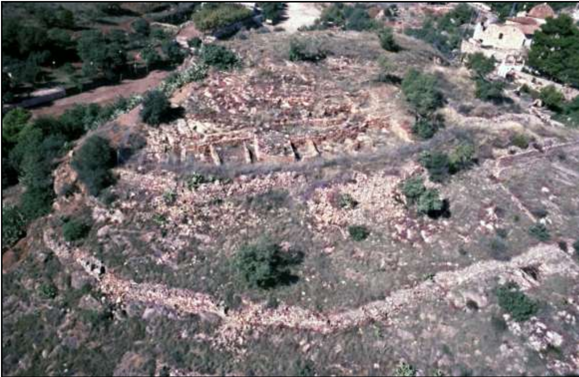
Vista aèria del Poblat de Sant Josep.

En algun moment durant l'època ibèrica, el poblat va ser abandonat, fins que al segle IV dC. va ser ocupat pels romans.