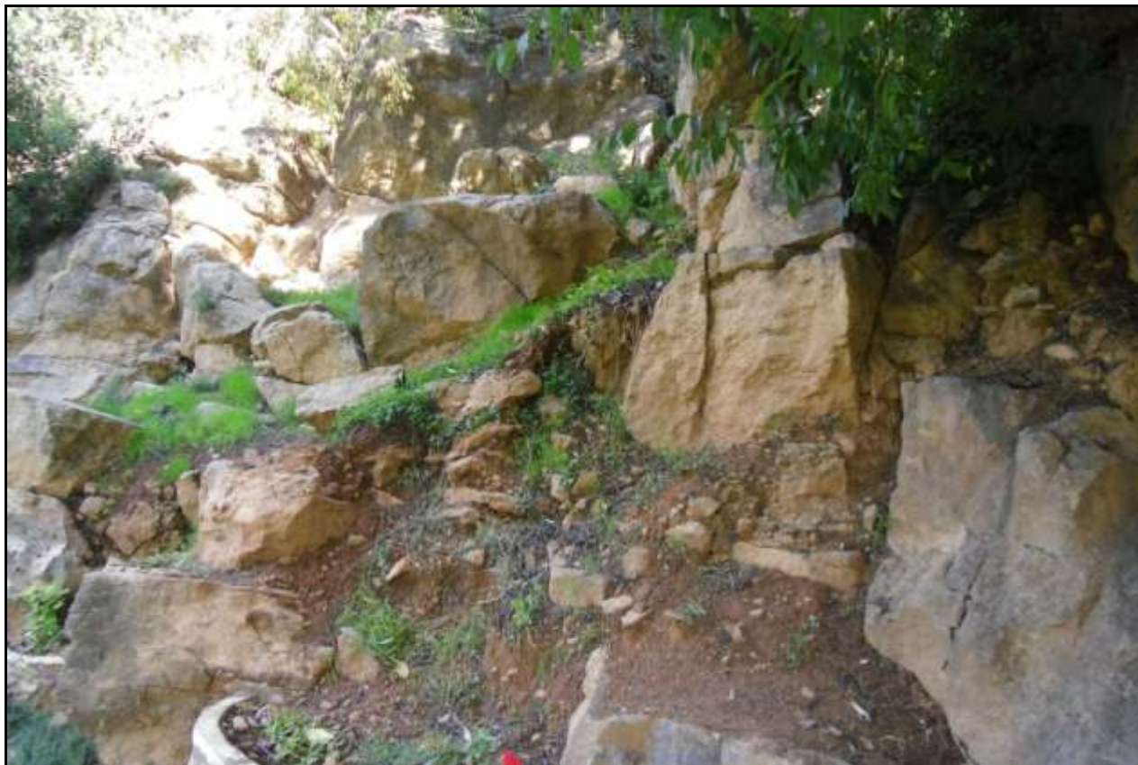
Turó de Sant Josep. Boca de la cova coberta per terra i pedres.

La muntanya de Sant Josep està infestada de multitud de coves i clavills que estan totalment farcides de terra, per la qual cosa no podem, de moment, saber el que contenen. Les cavitats que estan relacionades directa o indirectament amb la cova de Sant Josep són: la Covatxa de l'Ermita, la Cova de Can Ballester, la Cova dels Orgues, Avenc de Sant Josep, Avenc de la Riera, Avenc de la Núvia, Avenc de la Guilla, Avenc de Cavanilles, etc.