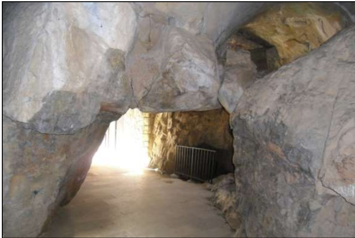
Cova de Sant Josep. Entrada.

Quan este procés es prolonga durant milers i milers d'anys, l'acció de l'aigua va creant un sistema de coves, unides entre si per túnels i galeries, com és el cas de la muntanya de Sant Josep, que es troba totalment perforada i infestada de coves i galeries, algunes més grans que altres, i moltes, encara sense descobrir, és a dir, totalment reblides de terra, pedres etc., fins a la seua boca i que, de moment, no ens permeten traspasar l'entrada.