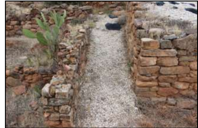
Detall d'un dels carrers.