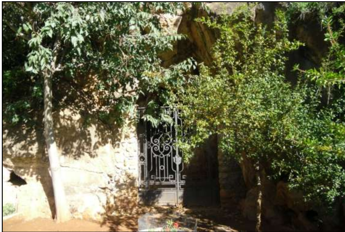
Entrada a la Cova dels Orgues.

Un poc més avant, podem trobar una altra gran cova: La Cova dels Orgues , en la que només es va realitzar una excavació en la part exterior de l'entrada. A través dels resultats d'eixa excavació podem saber que també la van habitar durant l' Edat del Bronze , en època ibèrica i també els fenicis .