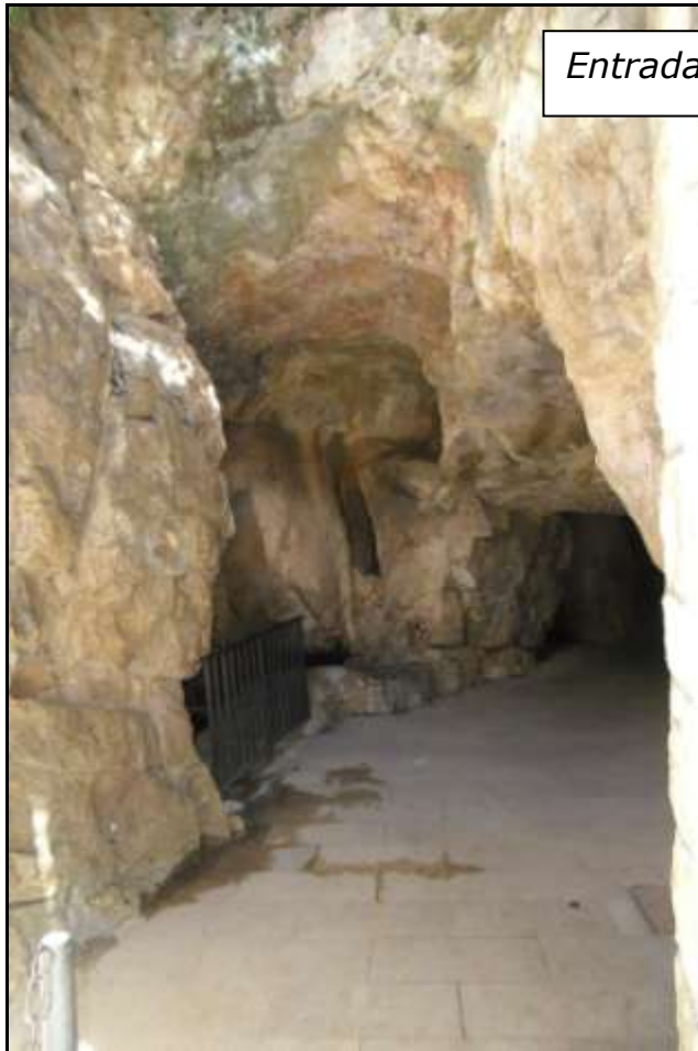
Entrada a l'embarcador on es troben les pintures.

Així, en la Cova de Sant Josep podem veure gravats i pintures rupestres que representen animals com a bous i cavalls i molts signes, tant gravats com pintats. Els gravats pertanyen a èpoques anteriors a les pintures i a les quals se va atorgar una cronologia post-paleolítica, encara que aquests estan sent revisats en l'actualitat.