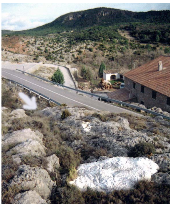
Foto1. Localización de la boca tapada, la pequeña grieta e indicación de la boca que queda abierta

La cavidad se encuentra muy cerca de la Ermita de San Bartolomé, en Villahermosa del Rio (CS) adonde podremos llegar por dos rutas distintas. S. Bartolomé está en una carretera local que une Villahermosa del Rio con San Vicente de Piedrahita, esta carretera la cogemos, bien en la parte baja de Villahermosa, llegando allí por la comarcal que va hacia Puertomingalvo, o bien por la general que va desde l'Alcora a Teruel, por Zucaina, Cortes,... esta segunda ruta es la más recomendable ya que nos evitamos el puerto desde Villahermosa, estrecho y con muchas curvas.