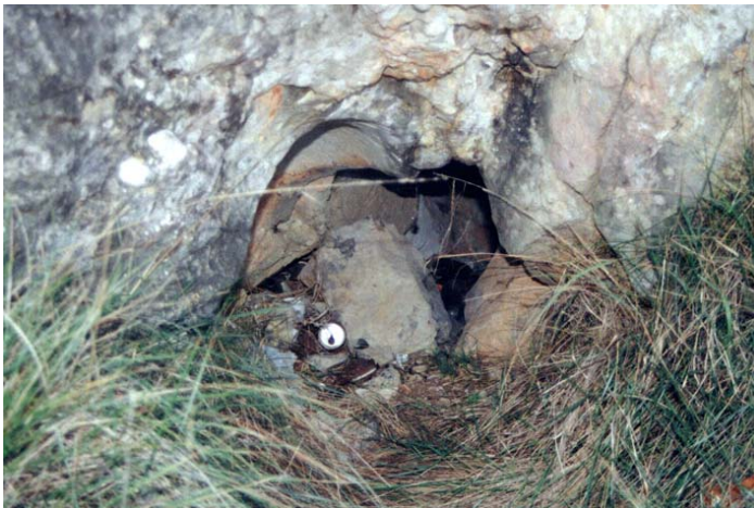
Foto 2. Boca de la cavidad tras la limpieza de basura y escombros.

Según me dijo mi abuelo, cuando trabajaba de “peón caminero” y estuvieron arreglando la carretera (años 60), entraban allí para guardar a refrescar el botijo y dejar la comida. Según me dijo él (ya falleció), en la cueva habían unas maderas que impedían pasar más allá, puesto que la cueva comunicaba con la iglesia del hermitorio, que era como una salida de emergencia (¿??). En aquella época el trazado de la carretera era un poco distinto al actual, pero no se nada más. Tal vez valdría la pena indagar un poco entre las brigadas de obras a ver cuando se modificó el trazado o quien tapó la otra entrada, e incluso se me ocurre preguntar en la Iglesia de Villahermosa (creo que S.Bartolomé depende de allí) la veracidad de esa comunicación o tunel.