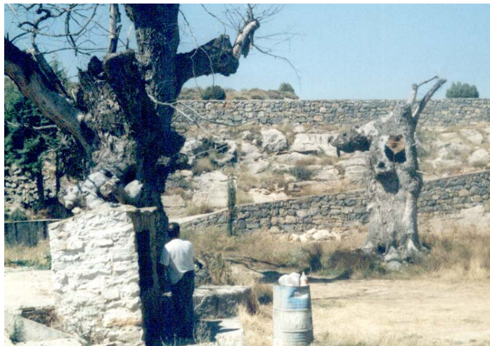
Mesas y barbacoas al fondo en la zona habilitada para merendero. Los grandes árboles (ya secos y muertos) que antes cubrían la zona de la fuente. En nuestra última visita ya los habían cortado y estaban retirandolos para plantar otros.