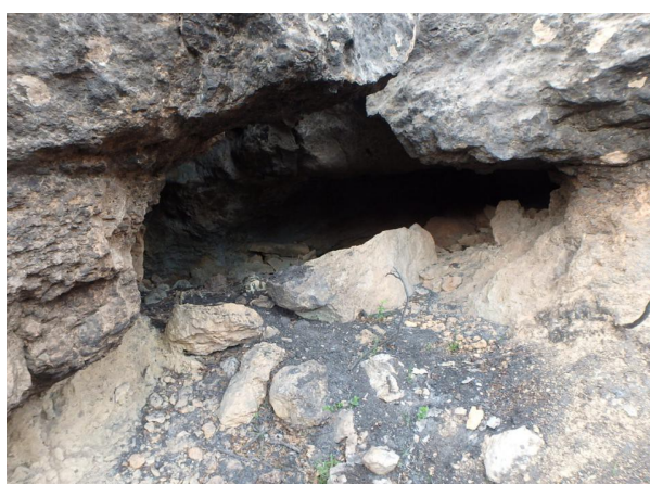
Refugio 5, boca de entrada