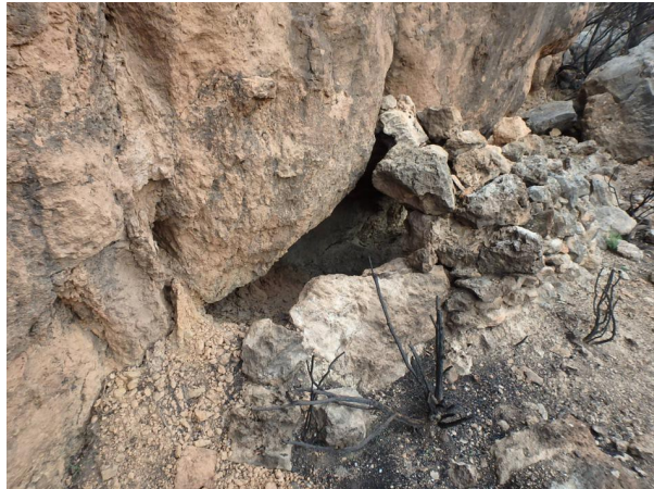
Abrigo Zorrera 1

Oquedad natural de unos 4 metros de larga, por 1 metro de honda y 1 metro de alta, cerrada por un pequeño muro de piedras, que permite cobijarse de la interperie.