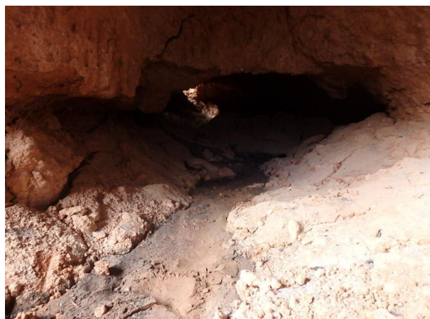
Interior del Refugio 1