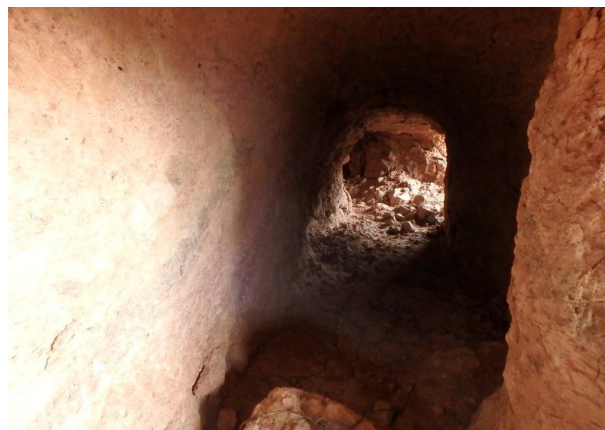
Refugio 3, una de las bocas e interior