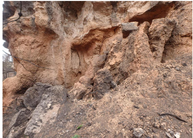
Boca del Refugio 1, y bocas derrumbadas del Refugio 1