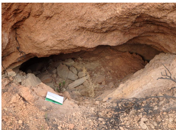
Refugio 4, boca de entrada

Refugio excavado con una sola boca, de 2 x 1 metros, que da lugar a una galería de unos 5 metros de larga, con fuerte pendiente de bajada, la cual busca conectar con el refugio 3, sin llegar a hacerlo. Se adjunta topografía.