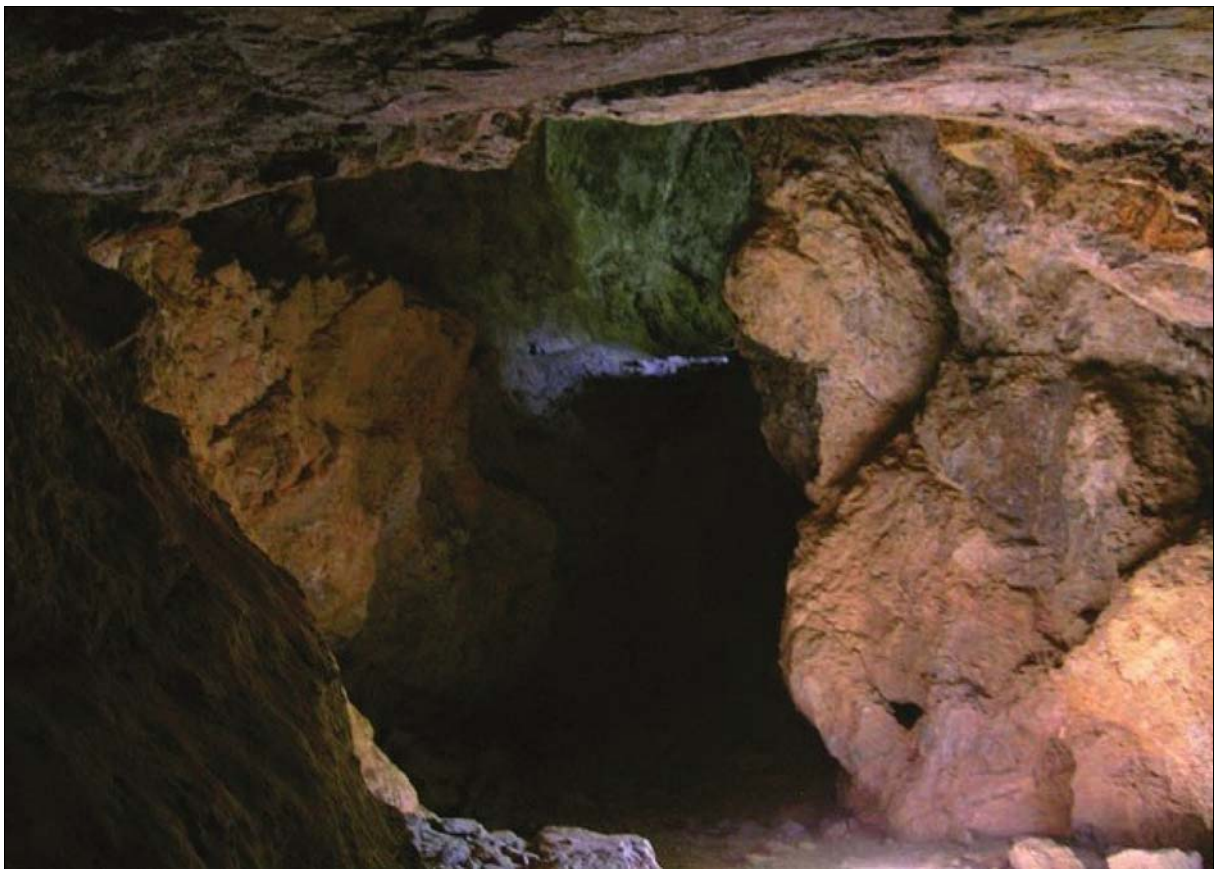
Fig. 6: Labores de la mina Cristóbal