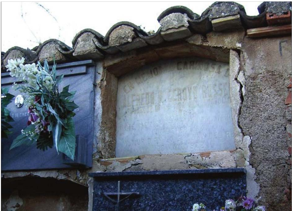
Figs. 16 y 17: Sepultura de Ecroyd, en Eslida