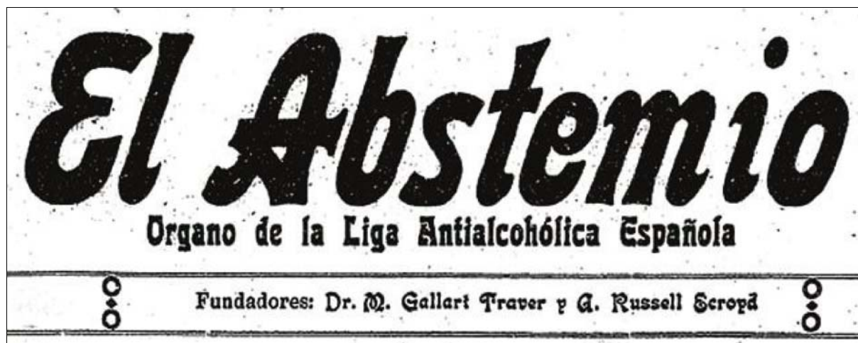
Fig. 11: Cabecera de El Abstemio

Por la elección celebrada por correo y cerrada en 31 del próximo pasado Diciembre, la Junta Directiva para los años 1913-14, queda constituida como sigue: