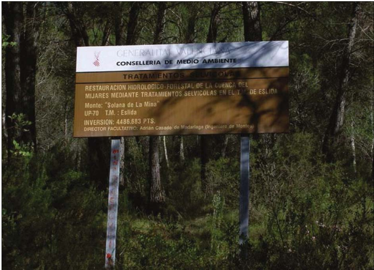
Fig. 5: Solana de la Mina