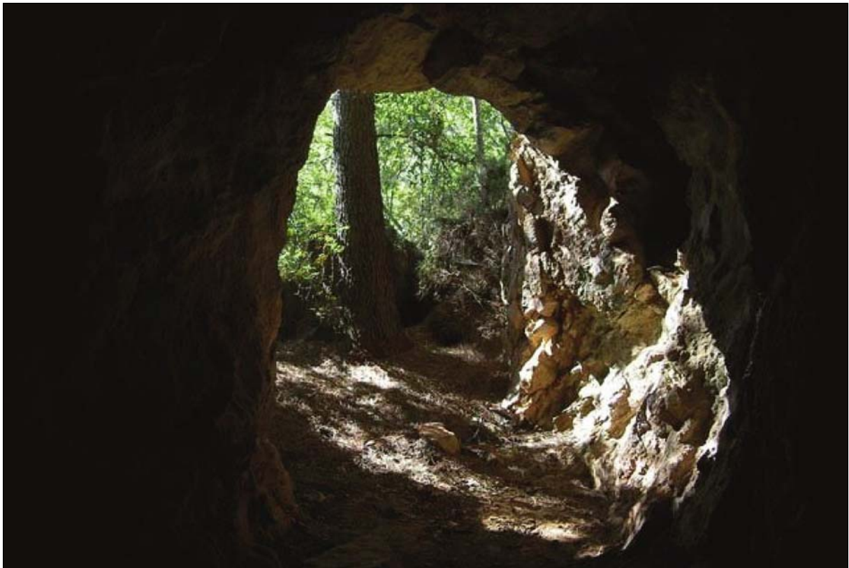
Fig. 7: Bocamina en mina Cristóbal

alguno que permita vincular a Ecroyd con aquellas minas, ni conociéndose las razones por las que el matrimonio eligió como su lugar de residencia aquel recóndito paraje, tan alejado para cualquier actividad que no fuese la minera. En la esquila mortuoria (Fig. 8) publicada tras su fallecimiento, la ocupación que se le atribuía era la de “propietario”, lo que bien pudiera darnos una pista sobre sus intereses en tierras de Castellón, mencionados ambiguamente también en otros documentos.