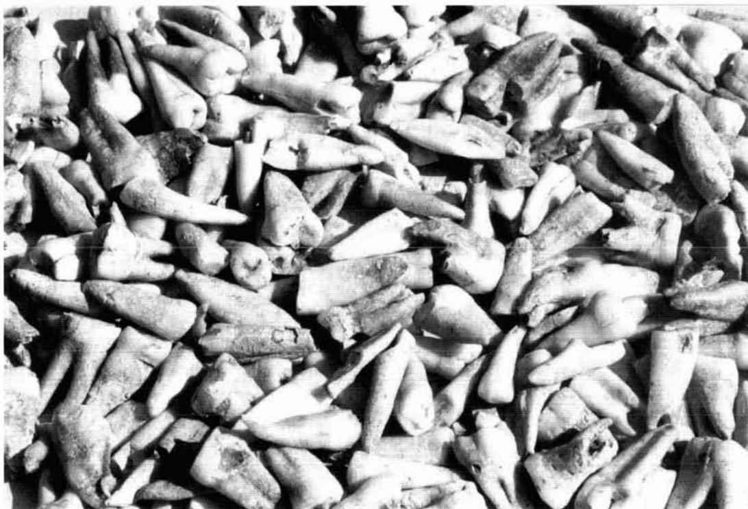
Lám. I.- Masadeta. Forma de presentación de los dientes.