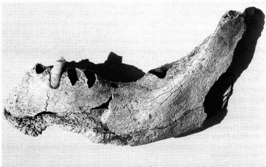
Lám. II.- Masadeta. Reabsorción alveolar, molares 36 y 37, por caída antemortem.