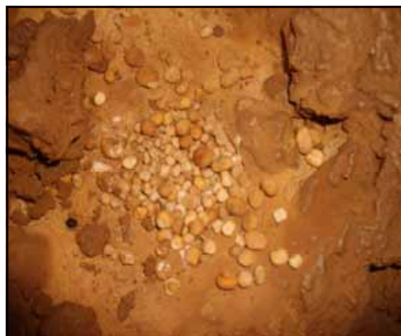
Nido de pequeñas pisolitas.

Recorrido real: 128 metros. Recorrido planta: 121 metros. Profundidad: -12 metros.