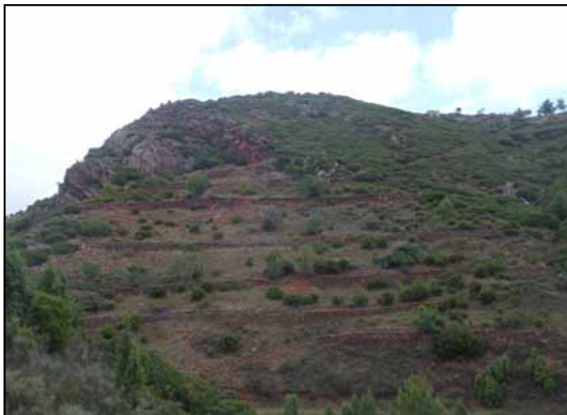
Zona donde se abre la cavidad, con la masía a la derecha.

La cueva de Juan Edo se ubica en el término municipal de Ludiente, a 4 kilómetros al NE de la población y en terrenos de la masía de Juan Edo. La cavidad se encuentra a la iz-