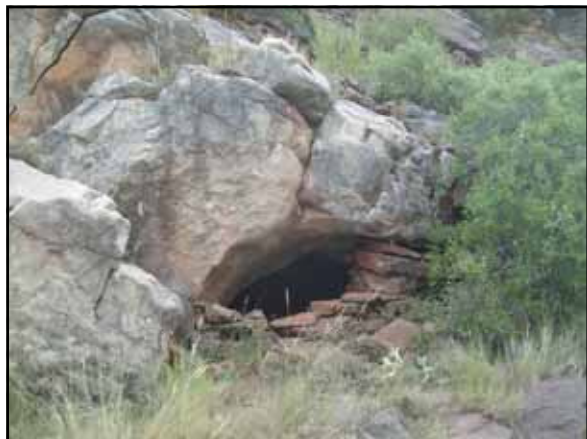
Boca de la cavidad.

pasada actividad hídrica, es atractiva por sus formas erosivas y bellos rincones, además se trata de una cavidad inédita desde el punto de vista espeleológico.