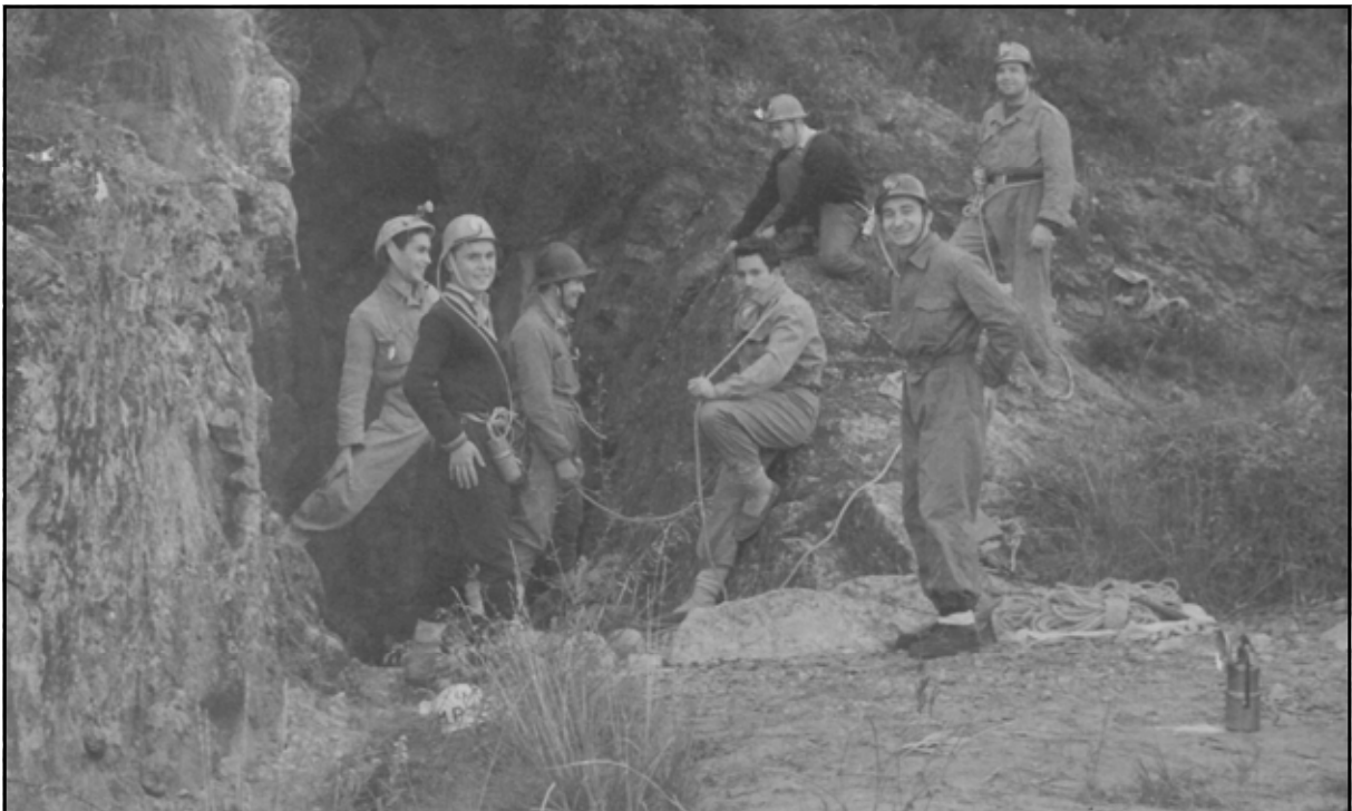
La Sima, Fondegulla, novembre 1960.

Ara també, com en l'inici de l'Espeleologia a Castelló, el grup és molt reduït però extraordinàriament actiu.