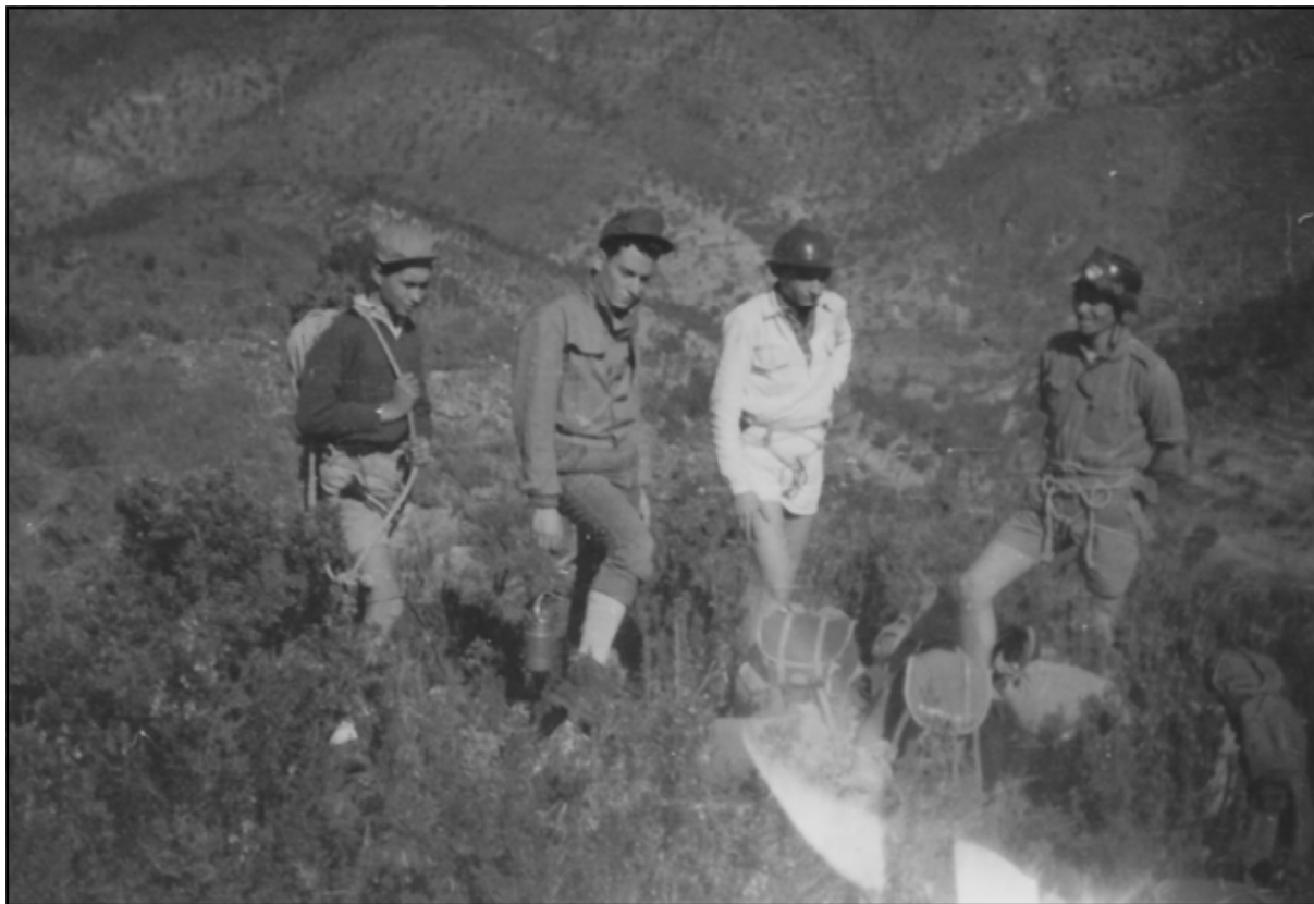
Serra Creu, Artana, 22 febrer 1959.

1960. A més de conèixer la cavitat, la intenció era posar en el més fons de l'avenc interior un taulellet commemoratiu dedicat a la Mare de Déu de la Cova Santa, obra dels ceramistes Guallart Ramos. A més s'exploraren algunes cavitats dels voltants, com la Sima de la Hiedra, que vam iniciar a pèl, sense material d'exploració, gent d'uns quants grups, però ja a l'interior hi havia una vertical preocupant; ací un membre del grup més ben situat econòmicament, recolzat i subvencionat per la Diputació de València, demanà un electron, l'escaleta metàl·lica, i mentre li arribava aquest el grupet del Centre, ben entrenat en escalada en roca, va fer el descens i l'esperà al peu. L'edat i la pobresa d'equip obligava a ser atrevits.