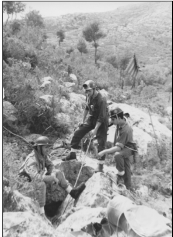
L'Avenc, La Pobla Tornesa, abril 1965.

Amb la fundació del Centre Excursionista de Castelló l'any 1955 hi ha un lloc on s'apleguen gents amb les mateixes afeccions i el camp s'eixamplà a termes com Cabanes, Orpesa, La Pobla Tornesa, Vistabella, Xodos, etc.