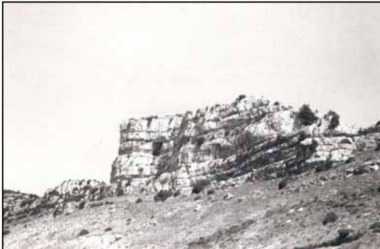
Castell de Corbó i cova encantada.

badas demuestran su mucha consistencia, y el mérito singular del arte, y gusto asiatico.