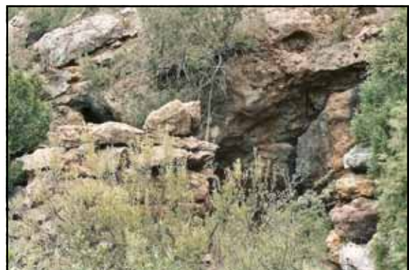
Cova de la Mina. Boca i tanca.

50/55 anys, va entrar de menut amb uns companys. Per a no perdre's portaven capdells de fil de palomar. En van utilitzar quasi sis. Prop de la boca hi ha aigua. També hi ha sales, no massa grans. En un lloc on hi havia fang van veure unes senyals d'espardenyes, la qual cosa els va esglaiar, però després es van adonar que eren velles. També hi havia senyals de roba de serpentina o cordonet. Van deixar les escopetes en la boca, amb els gossos, però portaven una pistola. A la boca d'un avenc interior hi havia una creu picada en la roca. L'avenc era fons. Van arribar a un punt on el de la pistola va davallar i va dir que no hi havia seguida.