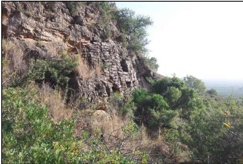
Figura 3: Cova del Moreno, Betxí.

depressió eren la causa de la dificultat a trobar-la. Té lloc i algun treball de condicionat, sobretot en l'accés, i fou l'amagatall d'algunes famílies. Com passa més d'una vegada, hi ha indicis d'amagaments en temps passats, del Bronze i medievals islàmics, d'aquests anys.