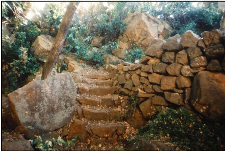
Figura 2: La Cova (Fondegulla). Treballs accés.

menuda i desapercebuda, i espai interior. Serví d'amagador al capellà del Santuari de la Vallivana i més membres del clergat de Morella (Sebastià, 2018).