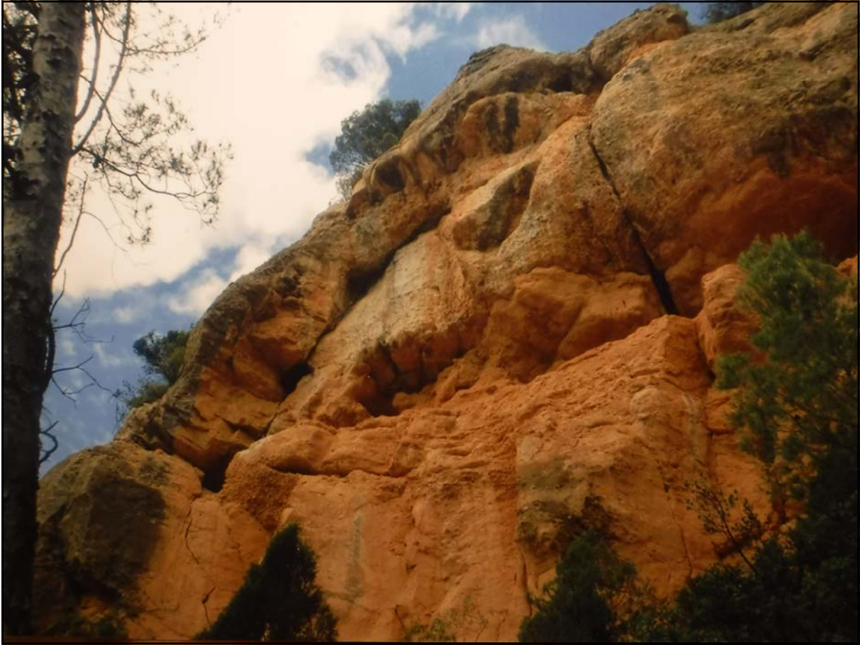
Figura 1: Las Cuevas (Aranyuel). Cingla a meitat paret.

A Villamalur la Cueva del Mas ja iqué en article anterior. De nou es pot afegir que un dels desertors amagats, en arribar els franquistes, volia presentar-se ben afaitat i com que no tenia aigua va usar pixats i pareix que de navalla feien unes estisores d'esquilar.