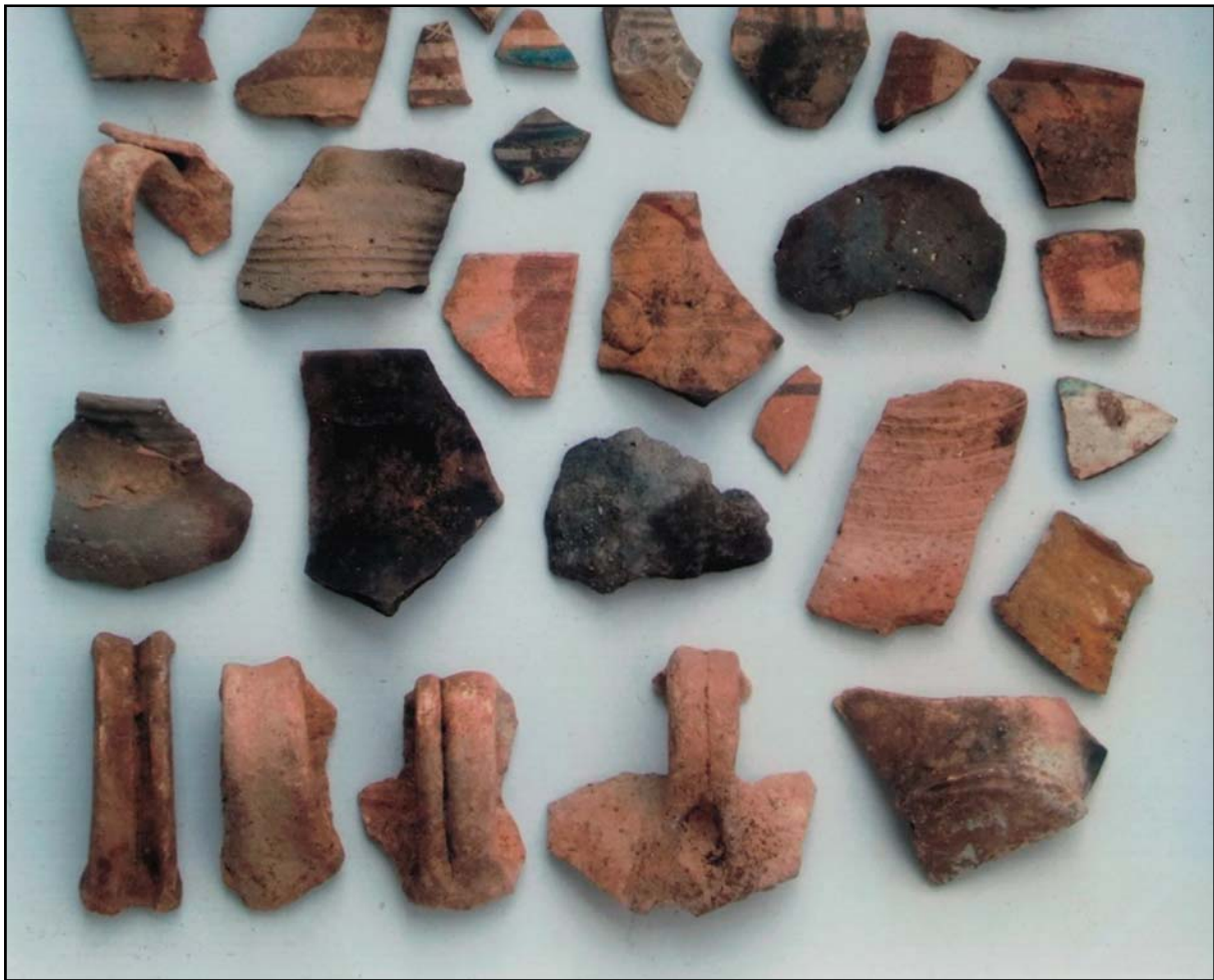
Figura 2: Testos dels voltants de la cavitat.