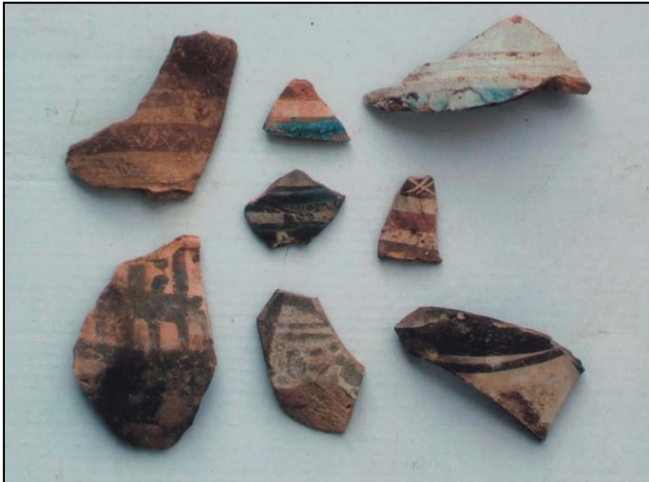
Figura 3: Testos de corda seca parcial, esgrafiats, engalba i manganés.