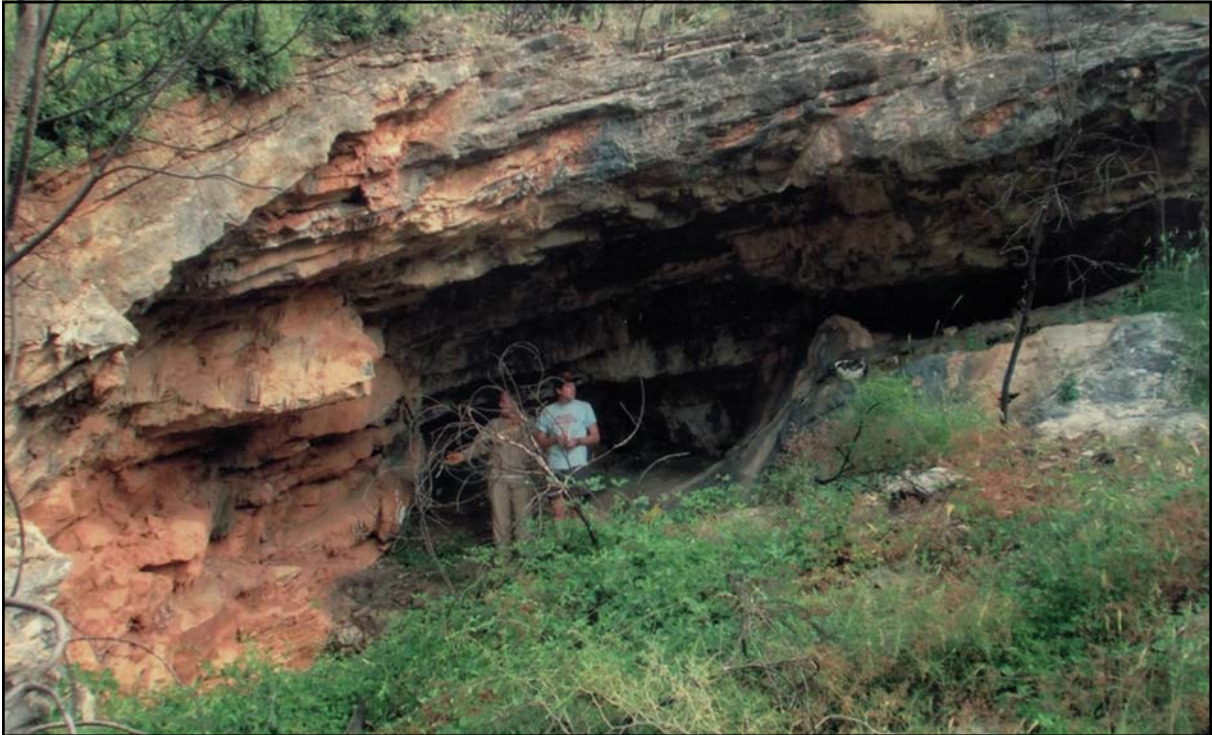
Figura 1: La cavitat en juny de 2016.

coses. Llavors la informació que aportà fou abundant, precisa com s'ha dit, pot dir-se que de primera mà, ja que quan s'assabentà dels treballs que s'havien fet en la cavitat es traslladà a Montant i contactà amb la gent que havia fet la troballa, va visitar la cavitat i va traure les seues conclusions per tal d'aclarir allò de l'amagament de les ceràmiques.