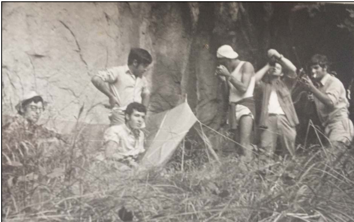
Figura 1: Acampada en una de les excursions que fèiem.

Així va entrar un altre i un altre fins que vam poder arribar els cinc que anàvem. Jo vaig passar l'últim. Darrere d'aquell "furgatxo" estava més ample i formava una saleta menuda. En aquest punt a mi em va fer una impressió, perquè xafaves, xafaves i estava tot cobert del fem de les rates penades, i ací vam dir: " açò sí que és una cova verge! ", ja que no està trepitjat per ningú; i algú de tots, amb l'eufòria de xafar zona verge, va dir: " hui els trobarem! hui trobarem els cadàvers! ". Així