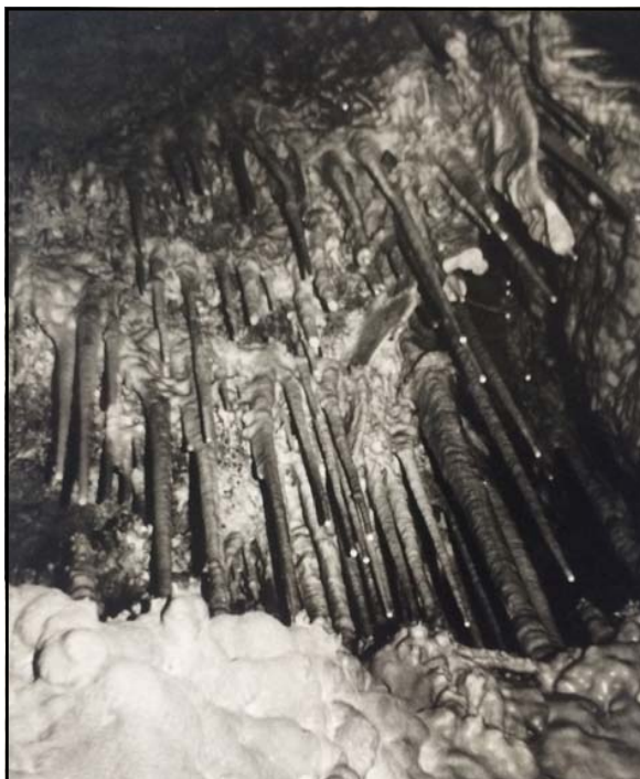
Figura 5: Estalactites d'una cova.

sos que no tiraren animals, que era una cova que podia entrar gent a vore-la, i ens van fer cas. En aquells anys crec que encara no estava fet el betlem d'argila que hi ha al fons de la cavitat. En una d'aquestes visites ens van acompanyar uns d'un grup d'espeleologia d'Onda, que anaven més organitzats i eixien més per tota la província, però no vam tindre més contacte amb ells.