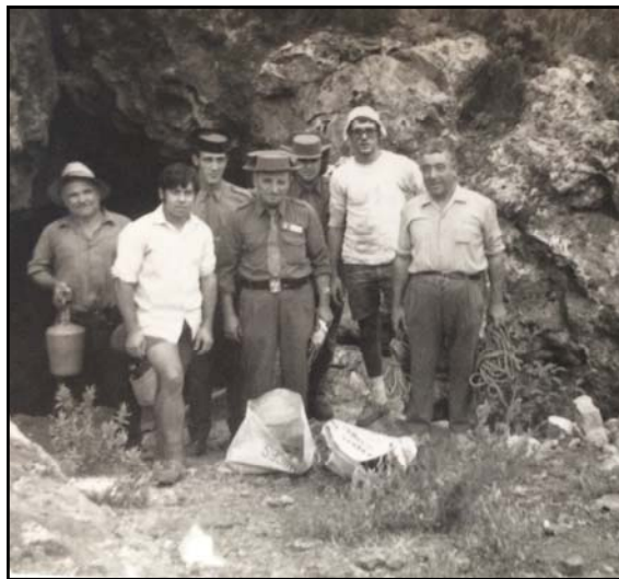
Figura 3: A l'eixida de la cova, dilluns 6 de setembre, on portaven els ossos en els sacs de plàstic.

La crònica, ja la tenien escrita i preparada per a publicar eixa mateixa nit; l'havia es-