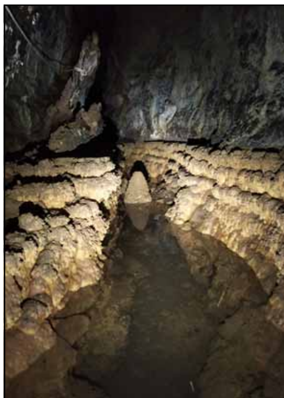
Figura 9: Los Gours ubicados en la zona nueva, con un pináculo o cono, formado dentro de la superficie del agua.