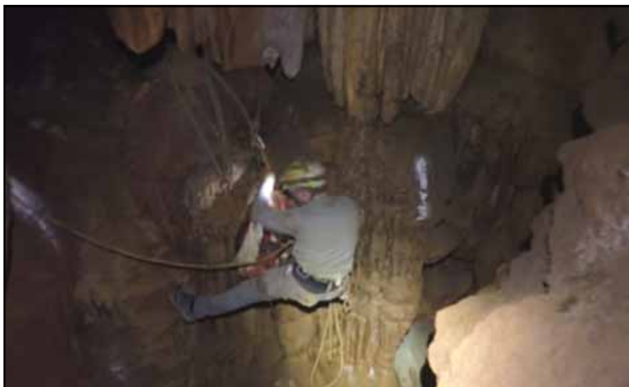
Figura 5: Pasamanos del Toro.

separaba de la salida una pequeña boca situada a unos tres metros de altura.