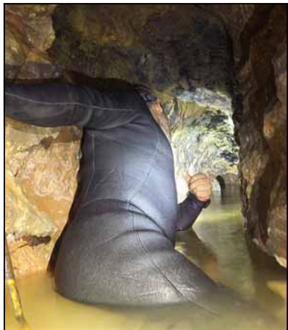
Figura 1: Galería del Barro.

del “whatsapp”, en el grupo de Espeleología “ Bojos pels forats ”, por la galería encontrada, no recibiendo información alguna al respecto por parte de los participantes de dicho grupo, lo que terminó por despertar en mi las ganas de explorarla.