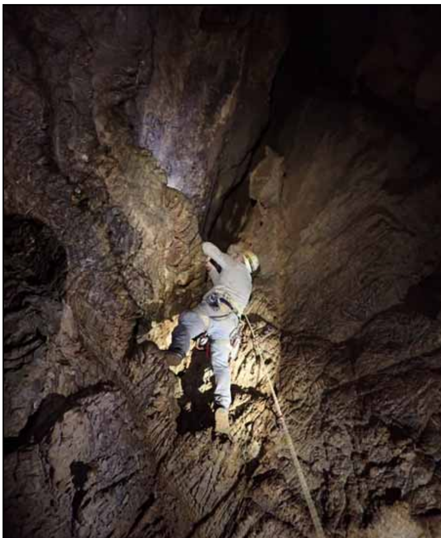
Figura 4: Escalando el pozo de los Mellizos.

fotos efectuadas a la galería, al pozo y a los "gours", invadiéndonos una inmensa alegría por el trabajo realizado y bautizamos al "Pozo como El de los Mellizos " (figura 4).