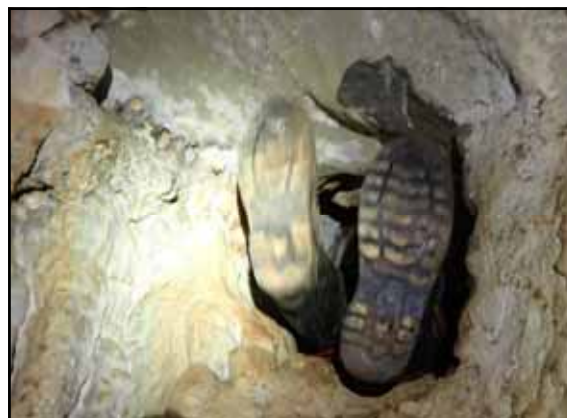
Figura 6: Paso de la Alegría.

guiendo finalmente conectar la Cueva del Toro con la Cueva de Chelva 2 (figura 8).