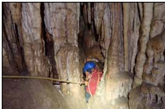
Figura 3: Paso de las banderas, desobstruido.