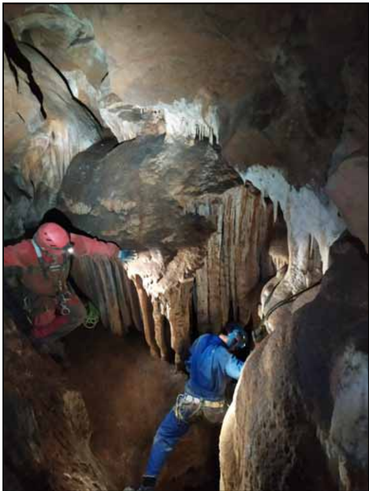
Figura 7: Sala ubicada detrás de las Banderas, con el paso estrecho en forma de pequeña ventana.

veinticinco metros de longitud, cuatro cintas exprés y material personal de seguridad (arnés, casco, frontal, traje de neopreno, material para rapelar y material para progresión ascendente). Si se va a realizar el Pasamanos del Toro, cuerda de treinta y cinco metros. (La travesía está equipada para recuperar la cuerda)