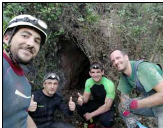
Figura 8: Salida por la Cueva Chelva 2, el día de la conexión.

Material necesario: Cuerda dinámica de veinticinco metros de longitud, cuatro cintas exprés y material personal de seguridad (arnés, casco, frontal, traje de neopreno, material para rapelar y material para progresión ascendente). Si se va a realizar el Pasamanos del Toro, cuerda de treinta y cinco metros. (La travesía está equipada para recuperar la cuerda).