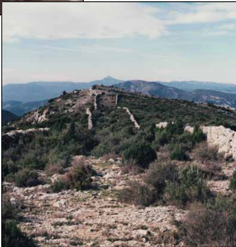
Figura 2: La Bastida.

Pel que fa a les mallades, a primers dels anys 70, a punt ja de despoblar-se el mas de Montoliu, a Xodos, preguntem al masover, pastor de tota la vida i bon coneixedor del territori, si sap que és una mallada, mot també present entre els topònims de la zona, com el mas de les Malla- des, però ignora quina cosa és; llavors li fem un poc de definició de la paraula i contesta: "Això que tu dius és una corralissa ".