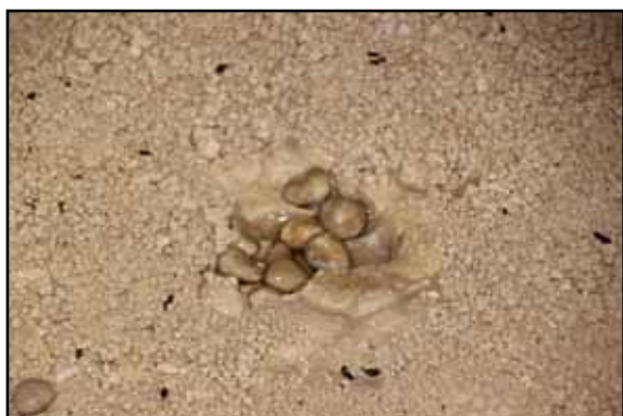
Figura 8: Perlas de caverna.

sale una estrecha galería en dirección este, en la cual fue necesario vaciar la tierra acumulada para pasar, esta con las paredes en fase erosiva nos comunica con una estancia voluminosa con aspecto de pozo, en el cual estamos a media altura flanquear en horizontal legamos al extremo opuesto, donde una cubeta inundable temporalmente tras un periodo de lluvias, con un color blanco impoluto. En este rincón se encuentran las formaciones más bellas y raras, también es muy frágil por lo cual está balizado cinta plástica para preservarlo.