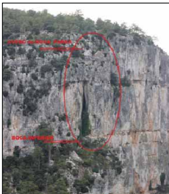
Figura 1: Situación de las bocas de la cavidad

Coordenadas datum: ETRS-89 – huso 30. X- 734534 Y- 4491611 Z- 1.022 m.s.n.m.