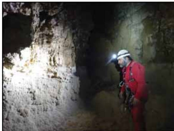
Figura 7: Bany de Cleopatra, pared lateral con detalle de las formaciones.

En la parte alta de este pozo, unos 3 metros por debajo de la gatera desobstruida