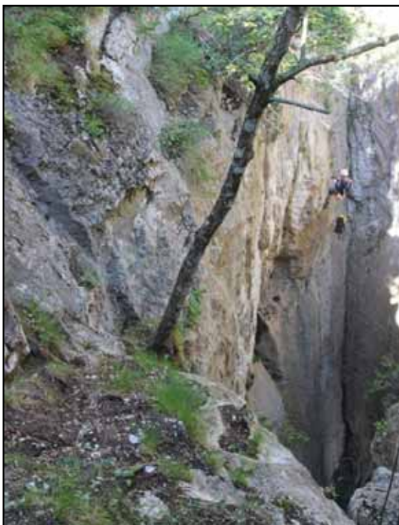
Figura 2: Aspecto del primer pozo de la cavidad.