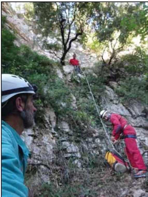
Figura 6: Acceso al avenc Encinglat.

ta atención y se descubre que dicha corriente procede de una pequeña gatera situada en la parte alta del pozo por la que no es posible introducirse, se ve que contiene un potente relleno de arcilla. Esta será retirada en la siguiente entrada con la ayuda de una pequeña pala de jardinería, en 15 minutos se retira material suficiente para atravesar la estrechez y proseguir la exploración. Tras unos cuantos metros de galería se alcanza una estancia más amplia con más de 6 metros de altura, en una de sus cúpulas se ve una chimenea por la cual han caído hojas secas tierra y materia orgánica, la galería continua en horizontal y tras cruzar por un puente formado por bloques se llega a una zona de gran belleza, se trata de una cubeta de 7 metros por 2 con marcas de inundación estacional y blancas formaciones subacuáticas (Bany de Cleopatra) en el extremo de la cual una bella colada desciende del techo, la cual aporta un caudal de agua variable según la climatología exterior (figura 7). Tras explorar todas las oquedades y el comprobar que el fondo del pozo está taponado por bloques, se decide salir al exterior en busca de la boca fantasma ya que a primera vista parece difícil de escalar. En el exterior tras un reconocimiento del terreno y calcular la posición aproximada no vemos nada, tras unos minutos de reflexión se opta por escalar un tramo del cortado de roca hasta una repisa