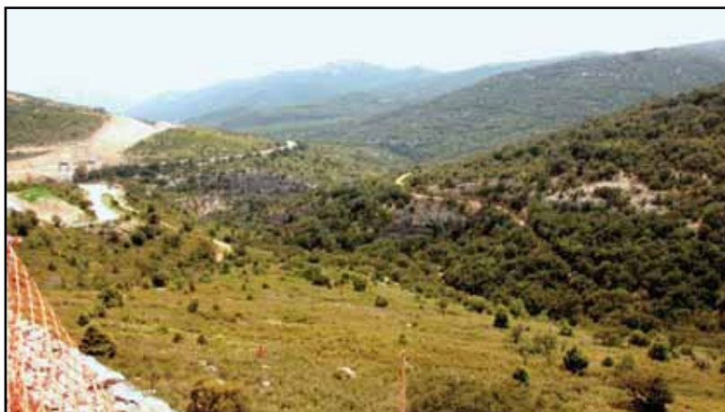
Figura 4: Vista panorámica del barranc de Querol en el entorno de la cavidad.

La cavidad que describimos a continuación fue localizada en diciembre de 2019, desobstruida y explorada durante la primavera del 2020 al final del primer periodo de confinamiento por el COVID 19. Su localización se debe a la persistencia en recorrer y prospectar zonas desconocidas sin ninguna referencia previa, junto con un toque de intuición y fortuna.