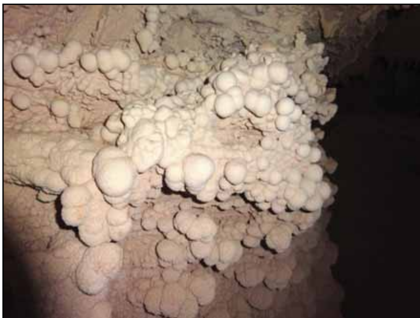
Figura 9: Formación de Marlekoritas.

En nuestro caso la formación está adherida a la pared formando un curioso racimo situada justo por debajo de la marca de llenado máximo de la cubeta, poseen una forma