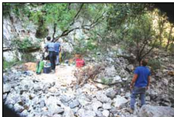
Figura 5: Espeleólogos junto a l'Avenc de Baix.

En el descenso se comprueba que la corriente de aire desaparece, al subir se pres-