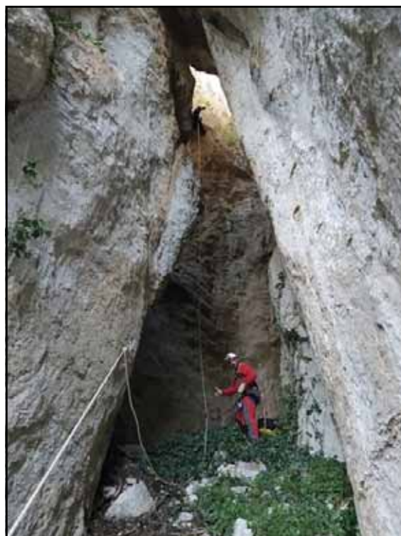
Figura 3: Repisa intermedia.

Los estratos inferiores pertenecen al Jurásico Superior y sobre ellos se asientan los del Cretácico Inferior sin que se aprecie diferenciación a simple vista. La cavidad se encuentra en la zona más alta, por lo tanto se desarrolla íntegramente en rocas del Valanginiense (Cretácico).