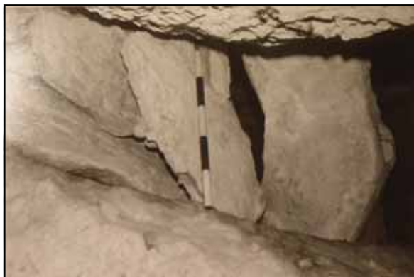
Figura 4: Tros de la tanca de protecció des de la part inferior.

terra, contra una pedra grossa. La peça, amb carenat lleuger i prenedor de llengüeta, té un alt de 65 mm, un diàmetre de boca de 71 mm, de cos 69 mm i la base uns 30 mm. El vaset té concreció en tota la volta de la boca, amb anemolites petites pels corrents d'aire de la cavitat.