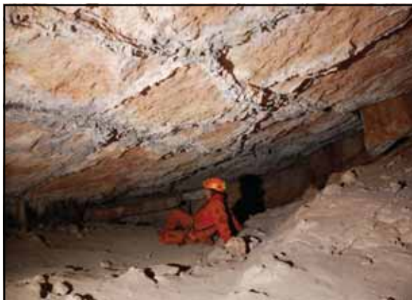
Figura 1: Sala Gran o del Bivac.

gran però de sostre poc alt. Ve després la seguida en avenc, que en les part amunteres se pot descendir sense equip, pels blocs encastats que hi ha.