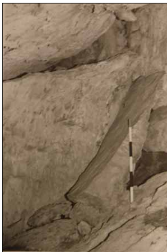
Figura 3: Part de la protecció de la seguida en avenc.

A l'altre costat de la sala, dreta si entres de la gatera, hi ha treballs de pedra seca per protegir sota uns blocs. En el primer racó, d'accés molt just, al treball de pedra seca es va afegir argila entre les pedres, segurament per allò dels corrents d'aire (figura 4). En el segon, també amb treballs a l'accés i als racons (figura 6), vam fer la troballa del vaset que motiva l'article. Els dos racons eren amagatalls dins l'amagatall.