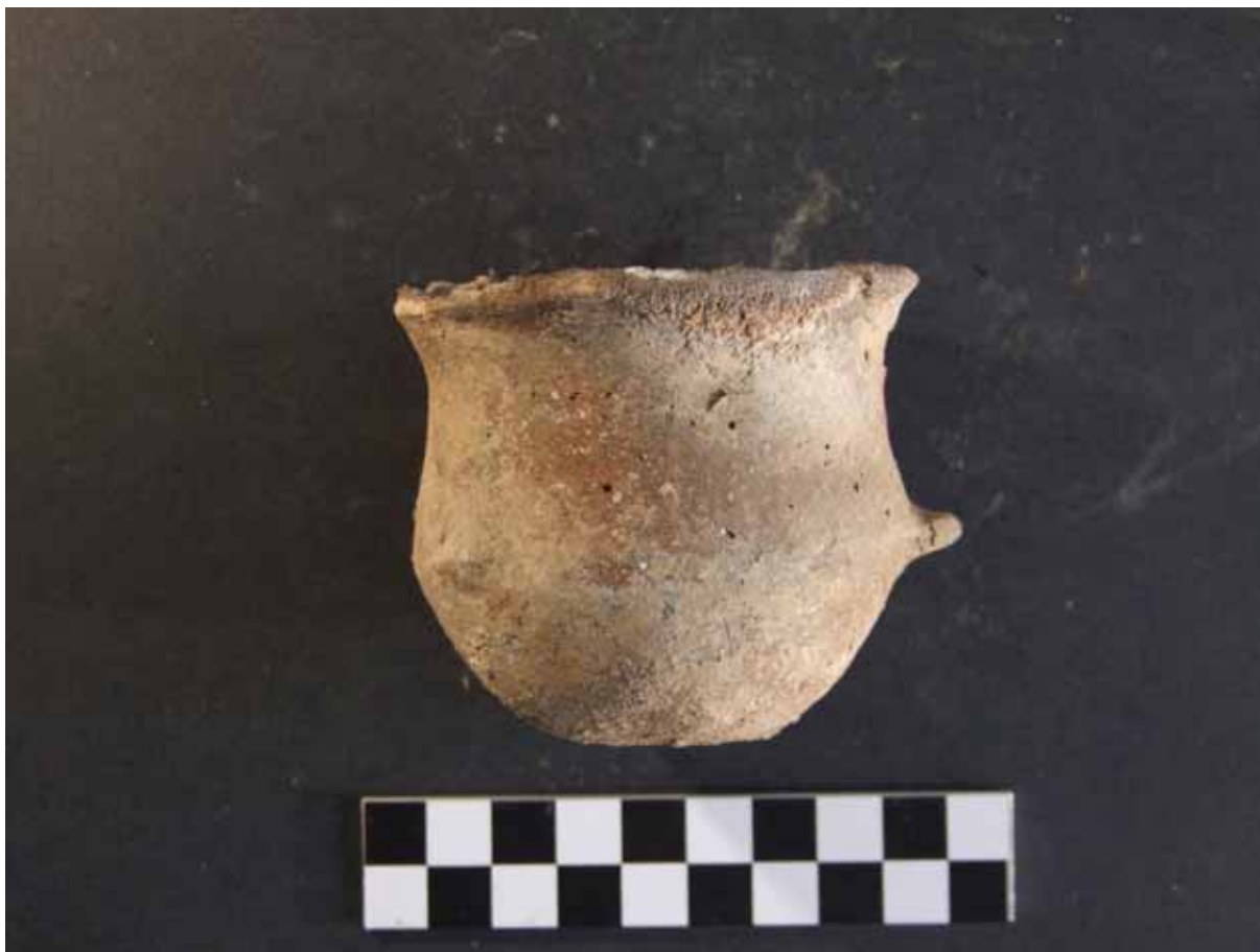
Figura 7: El vaset.