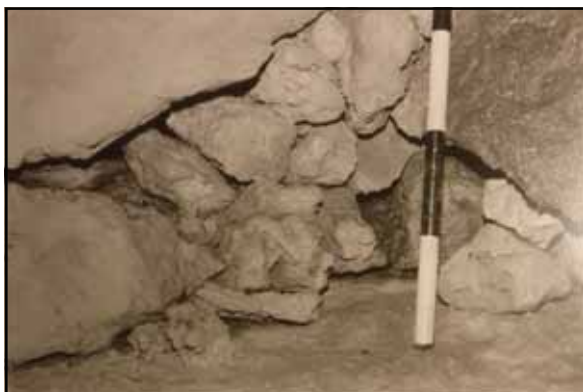
Figura 5: Treballs en els amagatalls infantils.

De les cavitats amb trencadissa de terrisses, amagatalls, penses que l'amagament tin-