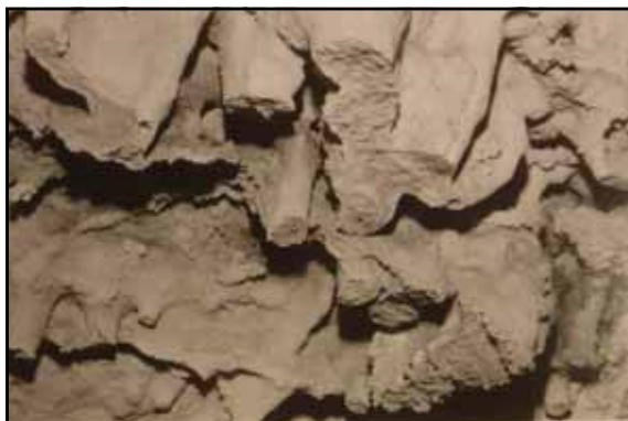
Figura 2: Concrecions trencades del sostre.

D'entrada, a l'esquerra, hi ha un bloc allargat i unes pedres posades per completar la protecció.