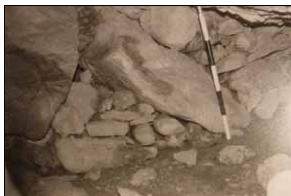
Figura 6: Treballs en els amagatalls infantils.

En la Túrio-5 la troballa del vaset li afegeix interès. Primer el lloc on estava, un amagatall dins l'amagatall, amb un accés molt reduït, un d'ells sols accessible per infants. El vaset, dret com el van deixar, podia ser un joguet del xiquet o xiqueta o per tenir algun líquid, aigua o llet. La seua troballa palesa la