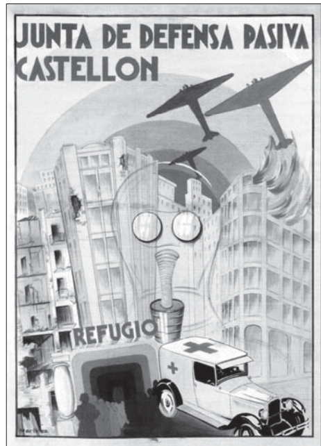
Junta de Defensa Passiva de Castelló (AA)

A pesar de les bones intencions de l'administració republicana, la realitat es va imposar i un temps després, quan els bombardejos eren ja un fet, les autoritats estatals i provincials van impulsar la creació de les juntes de defensa passiva, institucions encarregades d'adoptar les mesures pertinents per a protegir la població civil. Així, a principis de juny de 1937, s'acordava constituir 72 la Junta de Defensa Antiaèria de Vila-real, la qual s'integrava dins de la Junta Provincial de Defensa Passiva i, entre altres tasques, havia de promoure la construcció de refugis.