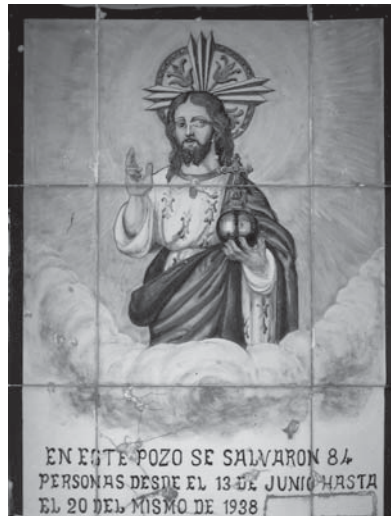
Capelleta a la sènia El Millars (AA)

Semblant va ser el cas de la sènia d'El Millars, també situada a la partida de Pinella, on s'hi van refugiar a l'escala del pou vuitanta-quatre persones, entre els dies 13 i 20 del mes de juny de 1938, fugint dels darrers bombardeigs alemanys i dels combats que van ocórrer dintre de la ciutat. Una capelleta commemorativa, dedicada al Salvador, recorda el fet.