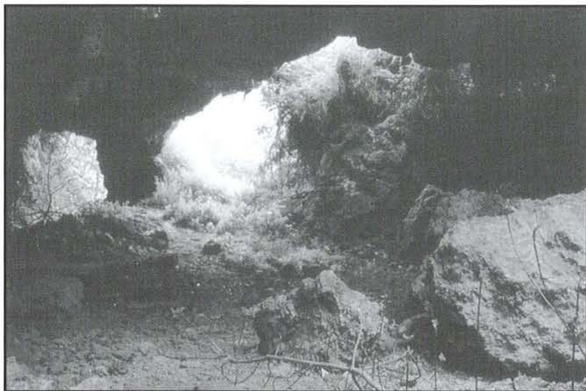
Interior de la Cova de les Ferreries.

Tots coneixem alguna cova o abric a la que sempre hem volgut fer alguna visita, però mai o quasi mai ho hem fet, hem passat molt a prop o l'hem vista de lluny i prou.