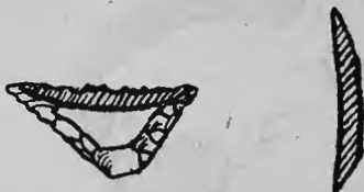
Fig. 4.—Microlit trobat prop de la cova de la Joquera

Després de l'èxit d'aquesta notable troballa havem recercat les coves adjuntes i remirat el vessant — encara que somerament i d'una manera com esport — no trobant fins avui, al meu poc entendre, res que faci emparentar amb aquesta cultura; sols un petit sílex treballat en forma de microlit havem trobat (troballa solta) en un punt distanciat de la cova, seixanta metres cap a Sud, on suposem que hi havia un abríc germà del de la pintura i que fa poc la pólvora ha fet saltar. (Aquesta muntanyeta és convertida en cantera per fer rastells d'acera; l'he dibuixat per si interessa als professionals.)