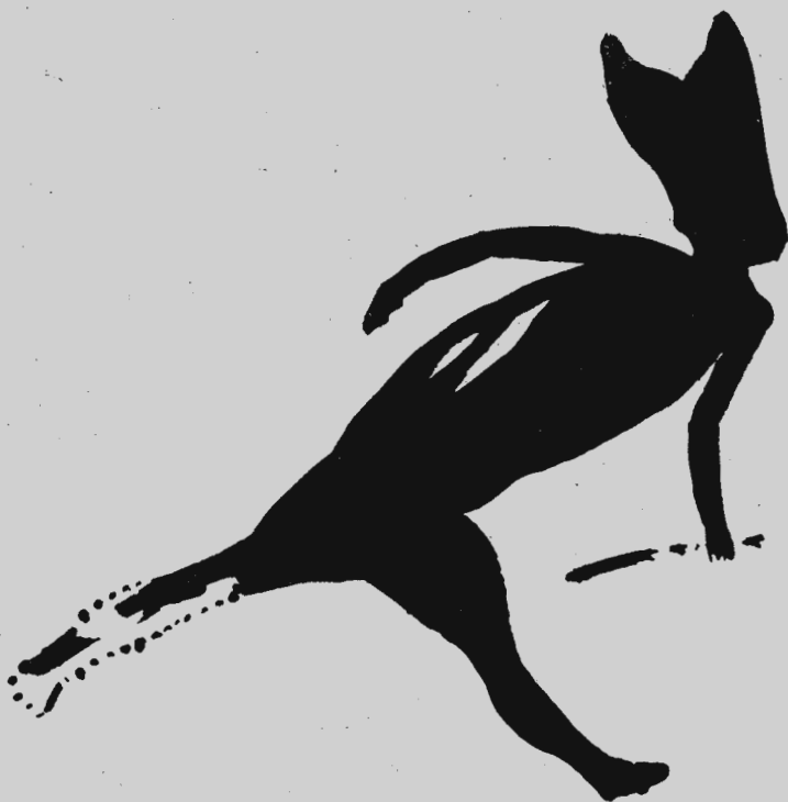
Fig. 5.—Esquema calcada de la figura que resta sencera (Tamany natural)