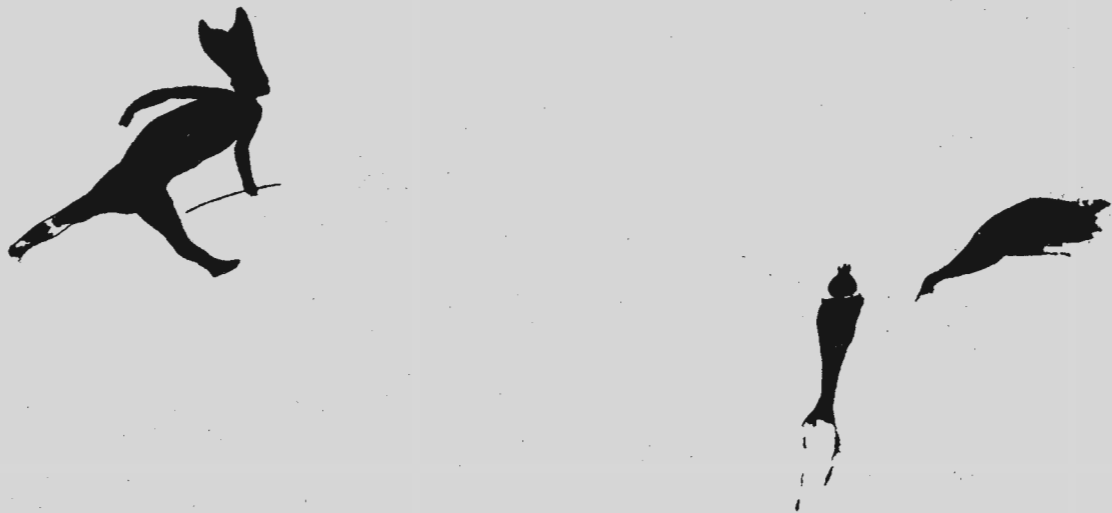
Fig. 3. — Esquema de la pintura de la Joquera ( \frac{3}{4} part del tamany natural)