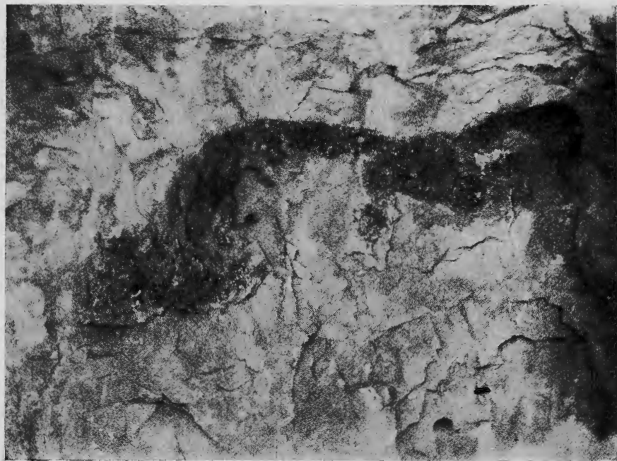
Làmina VIII.—Coves de dalt del cinglè. Animal cornut de 0'50 m. de llarg