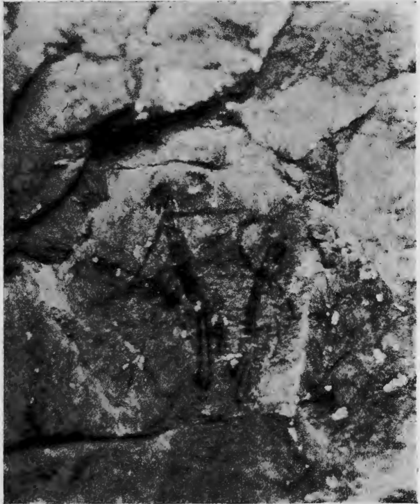
Làmina IV.— Figures humanes de la cova de Remigia