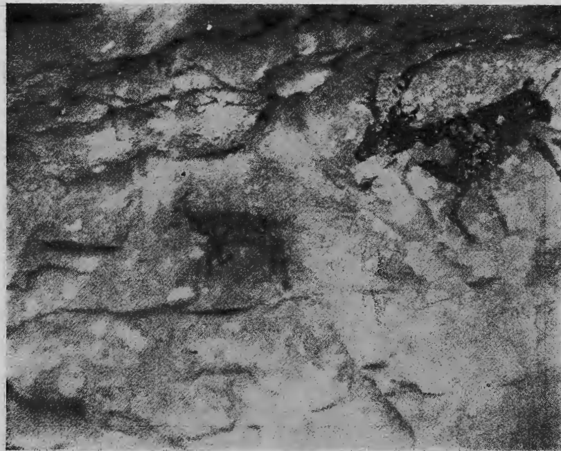
Làmina IX.— Coves de dalt del cingle. Ramat de cèrvols ferits de sageta