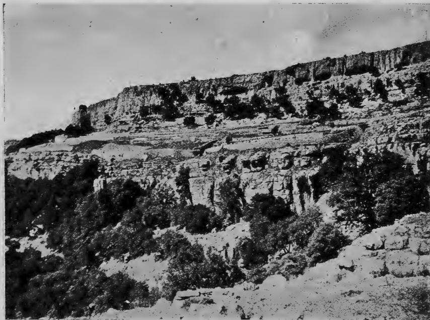
Làmina 1.—Vista general de la mola de Remígia. + Lloc on es troben les balmes