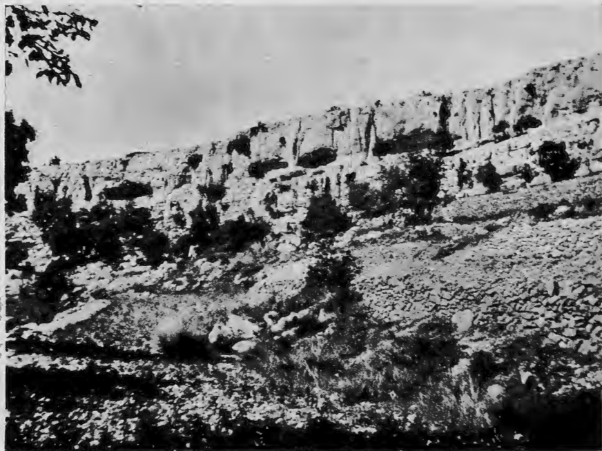
Làmina II.—Vista més propera de la mola de Remigia amb les coves +