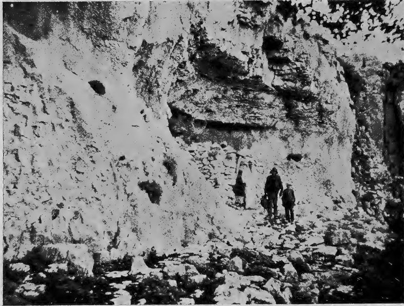
Làmina III.— La cova de Remígia