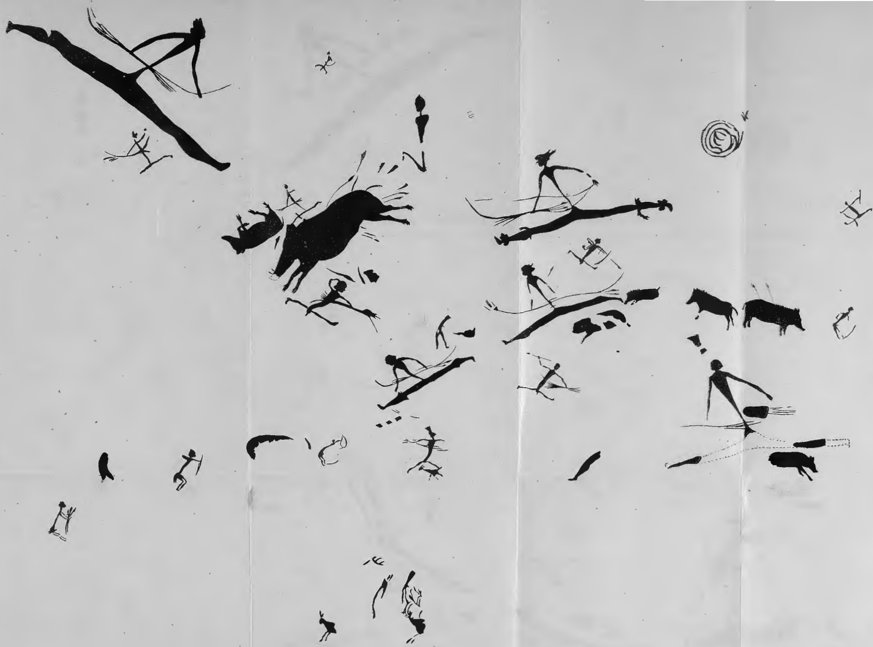
Fig. 8.—ARES DEL MAESTRE.—Cova de Remígia. Cacería del porc senglar