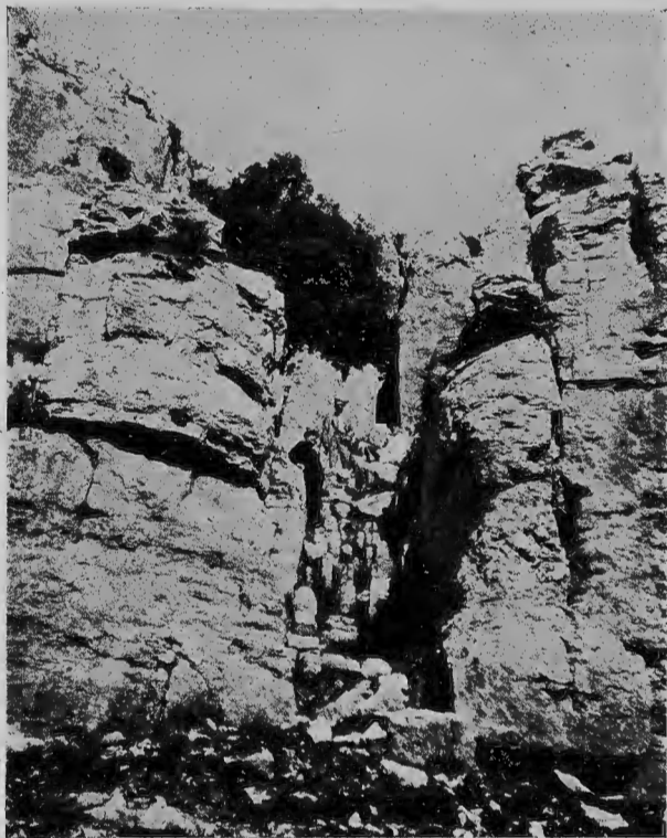
Lamina VII.— Escala d'estrats cinglers per a pujar a la mola on es troben les altres coves