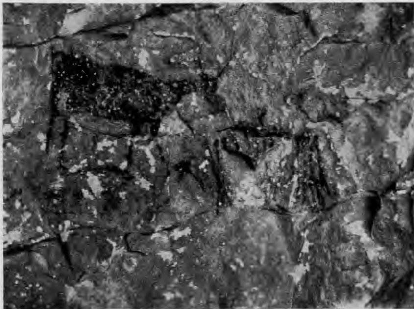
Làmlna VI.— Cova de Remígia. Cabra i falanx d'arquers