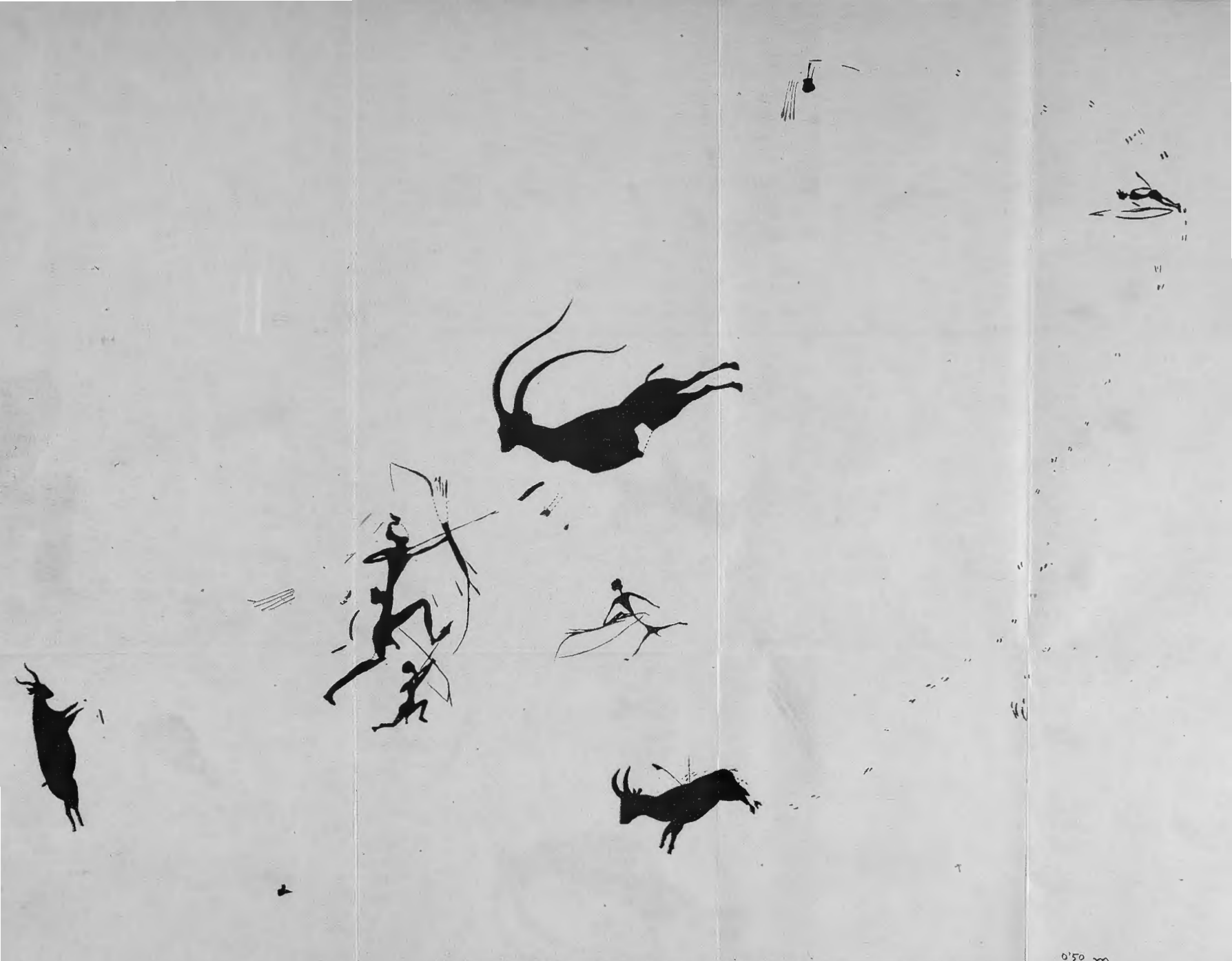
Fig. 2.—ARES DEL MAESTRE.—Cova de Remígia. Escena de caça de la cabra