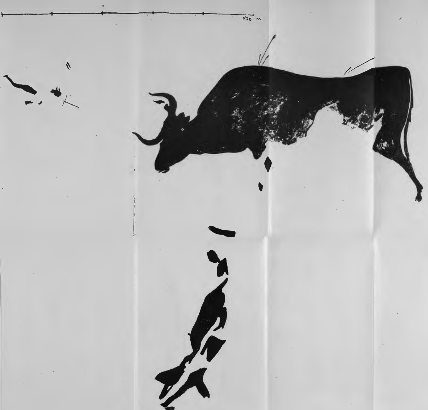
Fig. 5.—ARES DEL MAESTRE.—Coves de dalt del cingle. Figura d'animal cornut difuminada i policromada