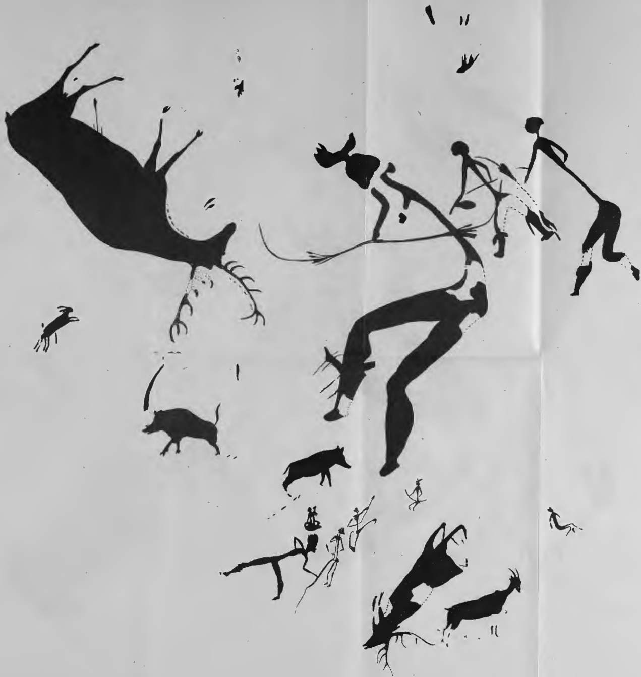
Fig. 4.—ARES DEL MAESTRE.—Cova de Remigia. Escena de cacería del cervol.