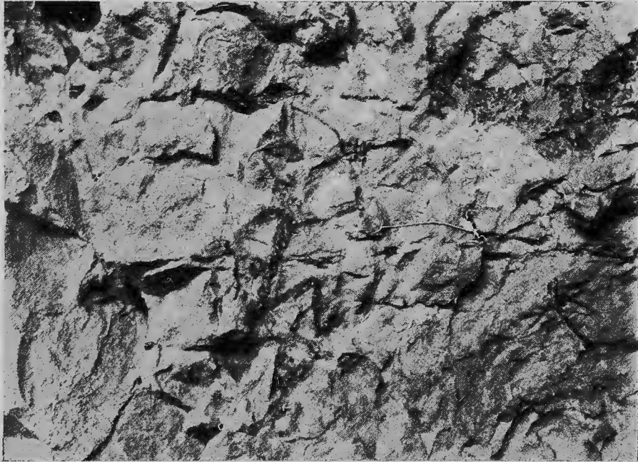
·Làmina V.—Cova de Remigia. Arquer disparant a la càbra