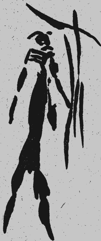
8.- ARQUERO. Color rojo oscuro. Tamaño del original. Abrigo octavo. Cingle de la Mola.