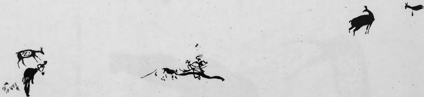
Pinturas del Racó de Gasparo