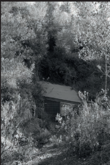
Aspecte actual de la boca de l'avenc de Fondegulla, cobert amb un sostre i una reixa que permet l'entrada de l'aigua de les riuades i alhora evita que es llancen brutícies o es produïska algun accident.