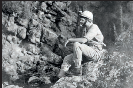
Aspecte antic de la boca de l'avenc. La foto és de l'any 1979 i mostra l'autor del reportatge abans de començar el descens a l'avenc.

dos brazos, últimamente, el cuerpo y a su lado el envase de una caja de jabón.