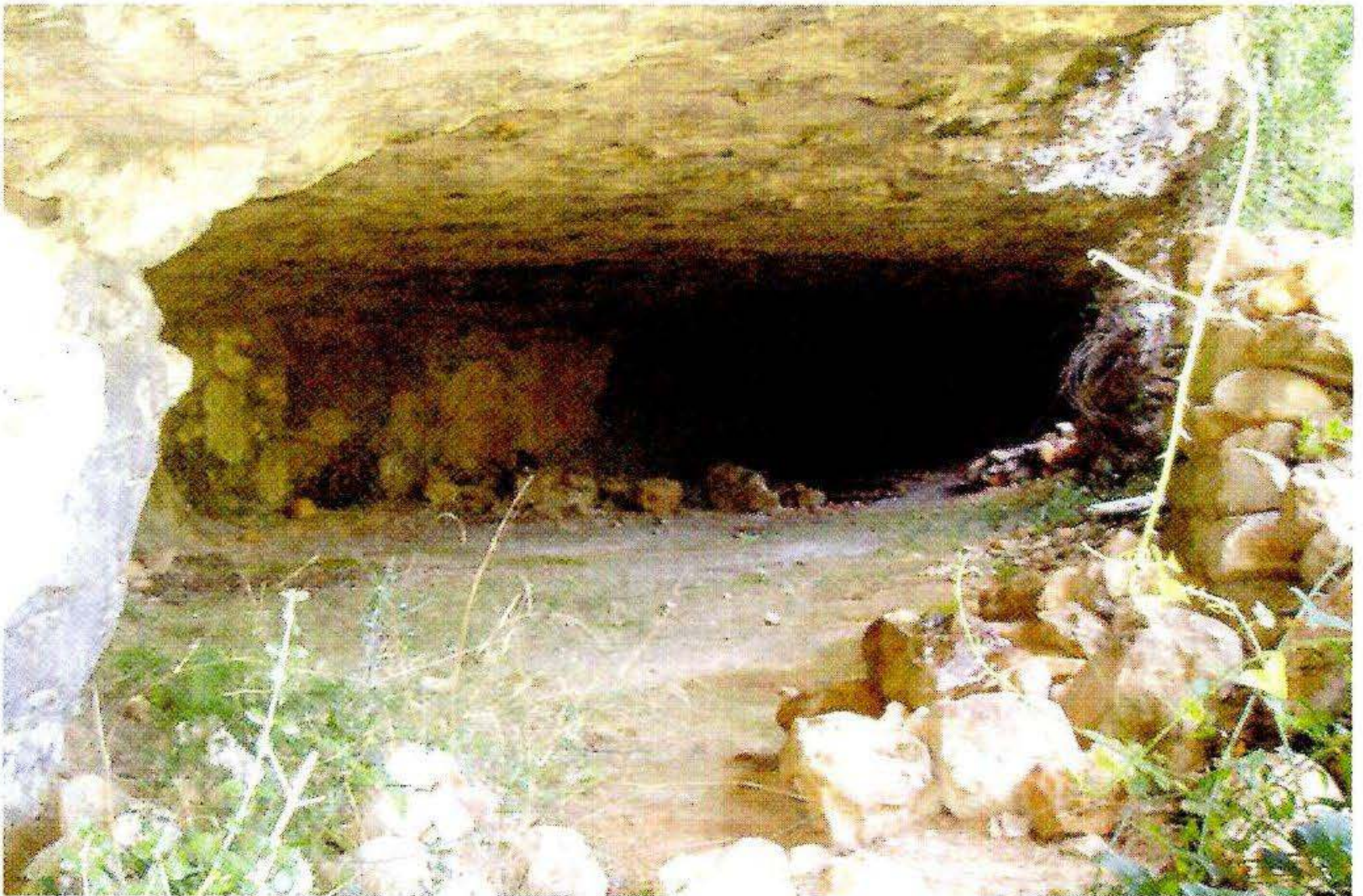
Cova del Ferrer, lloc on es va refugiar la població davant l'avançament de les tropes franquistes.