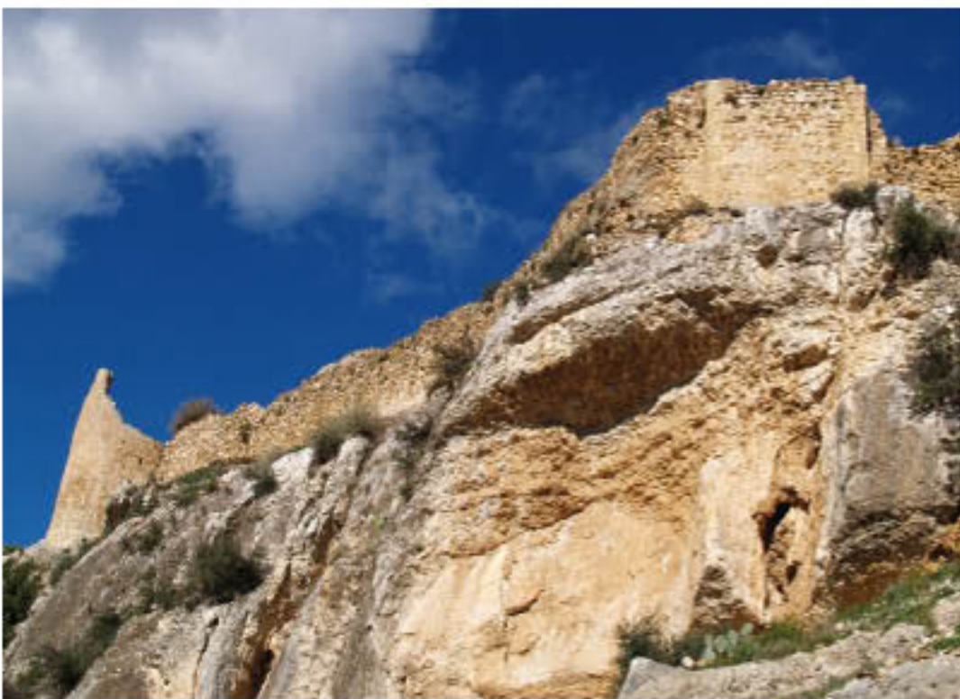
Castillo. Lienzo de muralla situado en la parte superior de la Cova Fonda

toda la comarca! Todavía hoy, en las noches más destempladas de invierno, pueden oírse los alaridos de la Faram. Los científicos le llaman simple viento..., pero los más viejos del lugar saben que se trata de los últimos quejidos de la Faram.