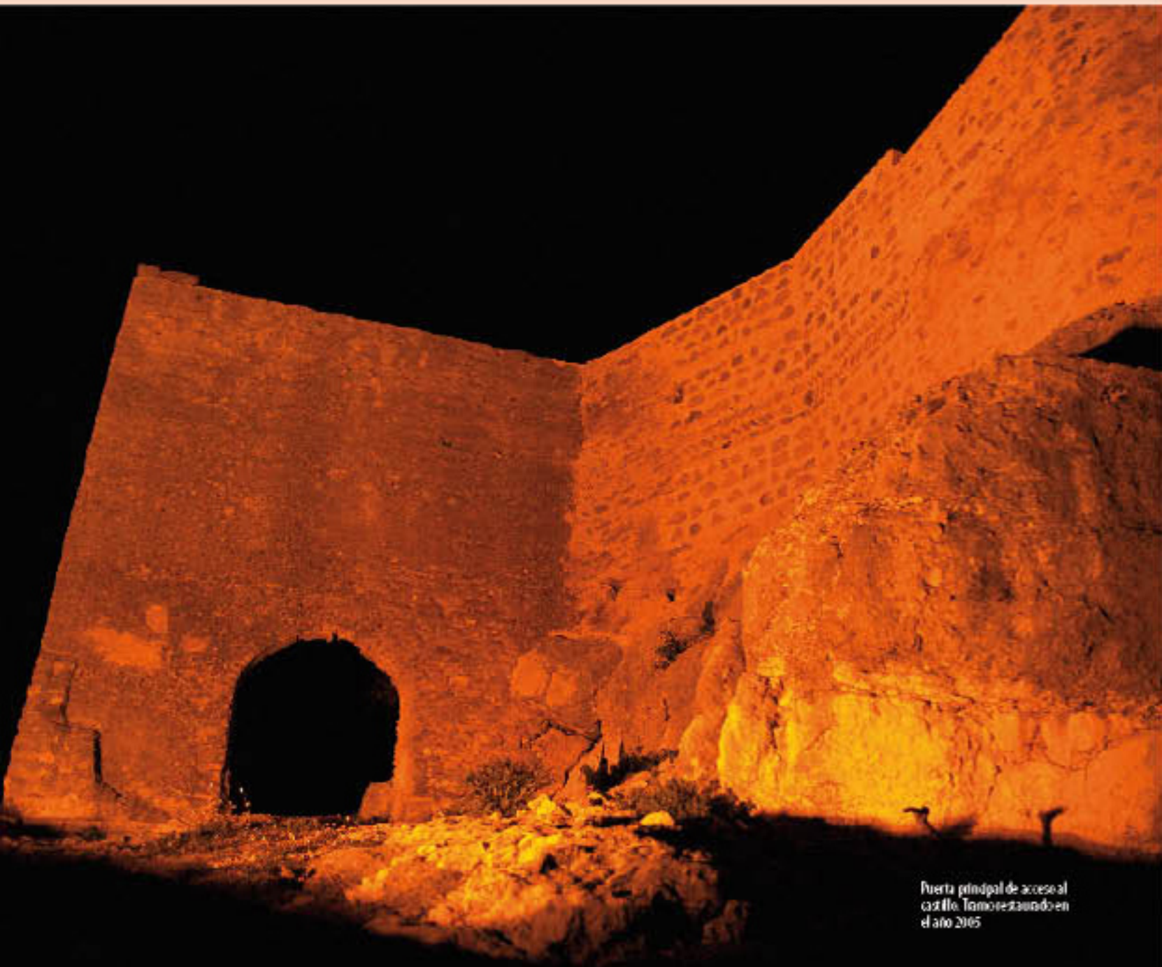
Puerta principal de acceso al castillo. Trabajo restaurado en el año 2005