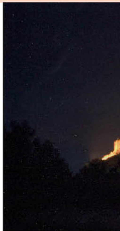
Vista panorámica de Cervera con iluminación nocturna

De hecho, hace ya bastantes años se halló en los bajos de una vivienda de la C/ Parras, situada en la falda geológica del castillo, el final de una conducción artificial de piedra y mampostería que, aunque parcialmente derruida, parecía corresponder a la salida de uno de esos túneles. Por otra parte, la tradición popular, unido a fuentes orales de reconocida solvencia, así parecen indicarlo. En consecuencia, deberán ser las excavaciones arqueológicas las que determinen la posible existencia de estas cavidades artificiales, sobre todo en una zona que, como la del castillo, experimentó a partir del siglo XVIII un proceso de relleno a partir del acarreo de tierras y escombros para convertir la superficie en área de labranza. Todavía en el año 1957 un escritor natural del municipio relataba que la fortaleza "no mantiene más que unos pocos muros que