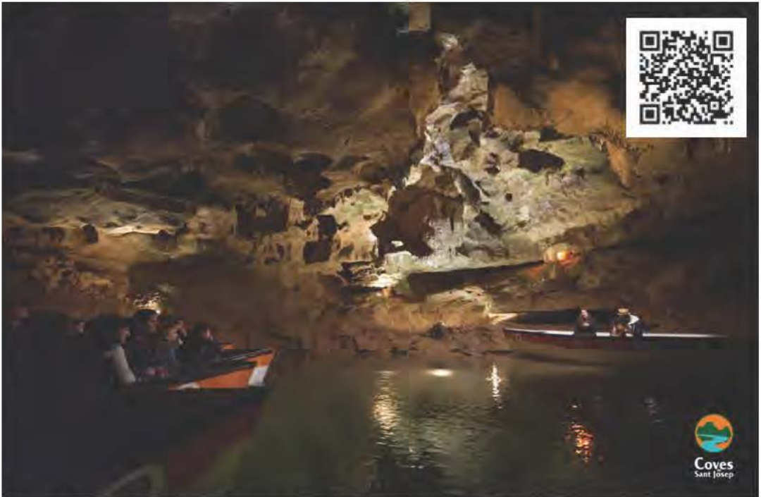
Figura 2. Imagen de un concierto durante el ciclo de Singin in the Cave de 2017 y código QR para poder acceder al audiovisual.

cia (de noviembre a abril), dónde el visitante toma conciencia del entorno, sus características y particularidades singulares de dicha cavidad, lo que la convierte en una iniciativa única en Europa.