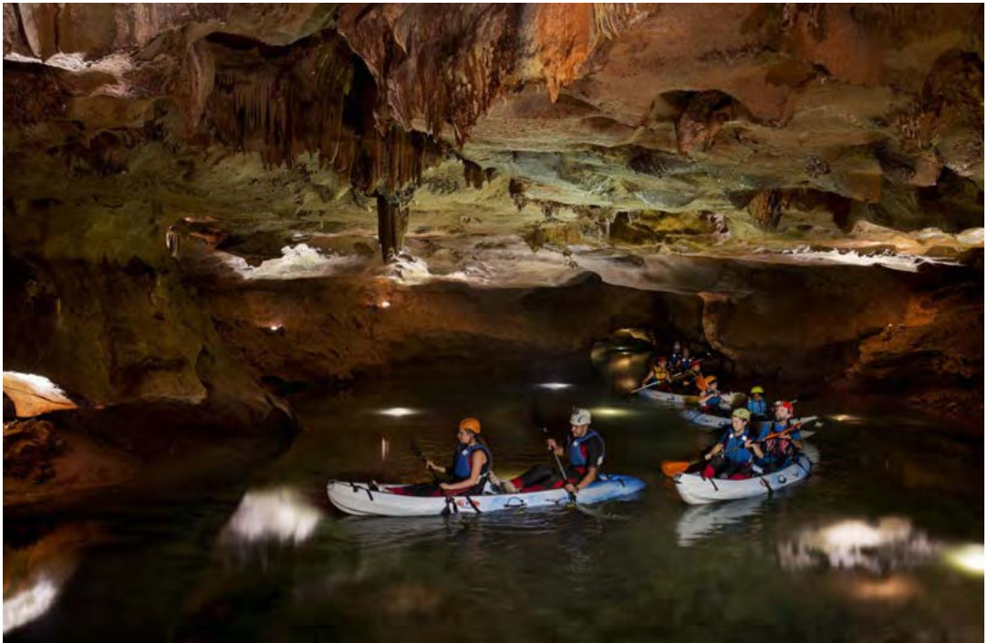
Figura 3. Visita en Espeleokayak a las Coves de Sant Josep.

un proyecto en este contexto, es con total seguridad el inicio de un proyecto exitoso. Para ello, este equipo ha sufrido un cambio en su modelo de trabajo más humanista, en contacto con el visitante, mejorando cada día los procesos internos de trabajo para dar el mejor servicio posible al cliente. Programas de coaching o aprendizaje para generar modelos de trabajo en equipo ha sido la clave del éxito durante estos más de 2 años (figura 4).