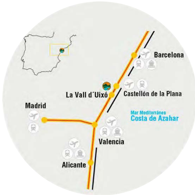
Figura 1. Ubicación geográfica de las Coves de Sant Josep, en La Vall d'Uixó (esquema geográfico sin escala)