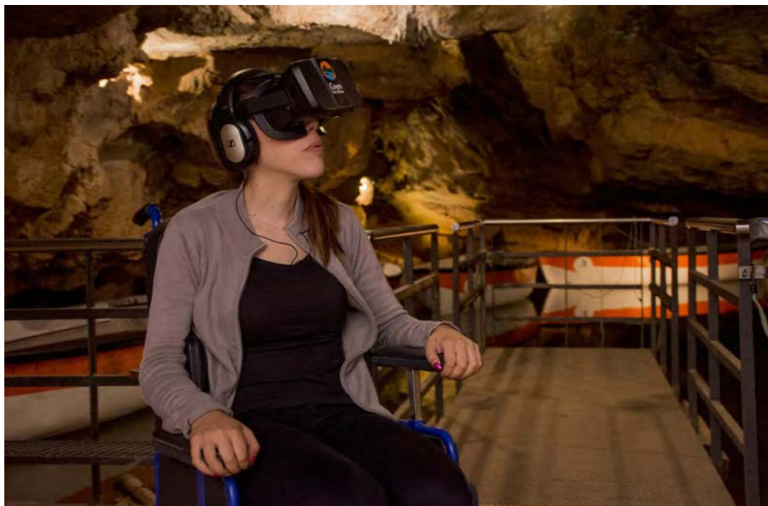
Figura 5. Imagen de una audioguía junto con las gafas de realidad virtual en una zona de la cueva con un acceso habilitado para la vista de turistas con movilidad reducida.

SEM ( Search Engine Optimization ) y SEO ( Search Engine Marketing ), nos hemos convertido en el primer criterio de búsqueda en Google como referente turístico en Castellón, la instalación de un tótem digital en la oficina de información para la venta de entradas virtual in-situ, la instalación de nuevo software de venta de entradas, promociones activas en redes sociales o la futura instalación de fibra óptica que permitirá que el visitante pueda acceder a las redes sociales durante la vista. Todo ello, acompañado de un nuevo sistema de audioguías y un sistema de geolocalización avanzado, son las acciones desarrolladas durante el último trienio (figura 6).