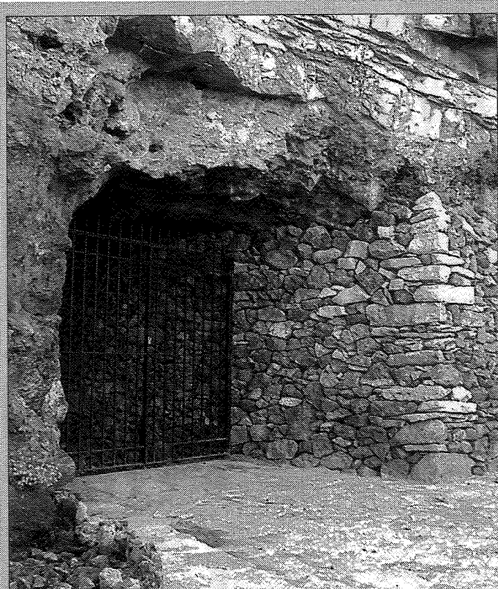
Entrada y recovecos de la mina de Culla.

El objetivo de las diferentes administraciones es recordar la actividad minera como un atractivo turístico. En Culla y la Torre existen decenas de viviendas de turismo rural. Se echa en falta actividades que dinamicen la estancia de los visitantes, más allá de las visitas al histórico y bien conservado casco urbano de Culla. Además de iluminar la mina