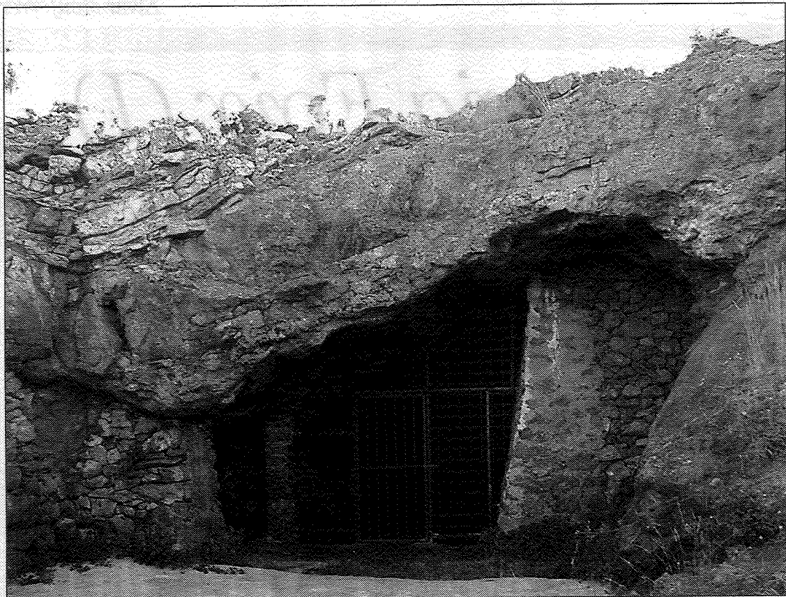
Acceso a la mina localizada en el municipio de Torre d'En Besora.

RINCONES LAS MINAS EN DESUSO SE CONVIERTEN EN UN NUEVO RECURSO TURÍSTICO