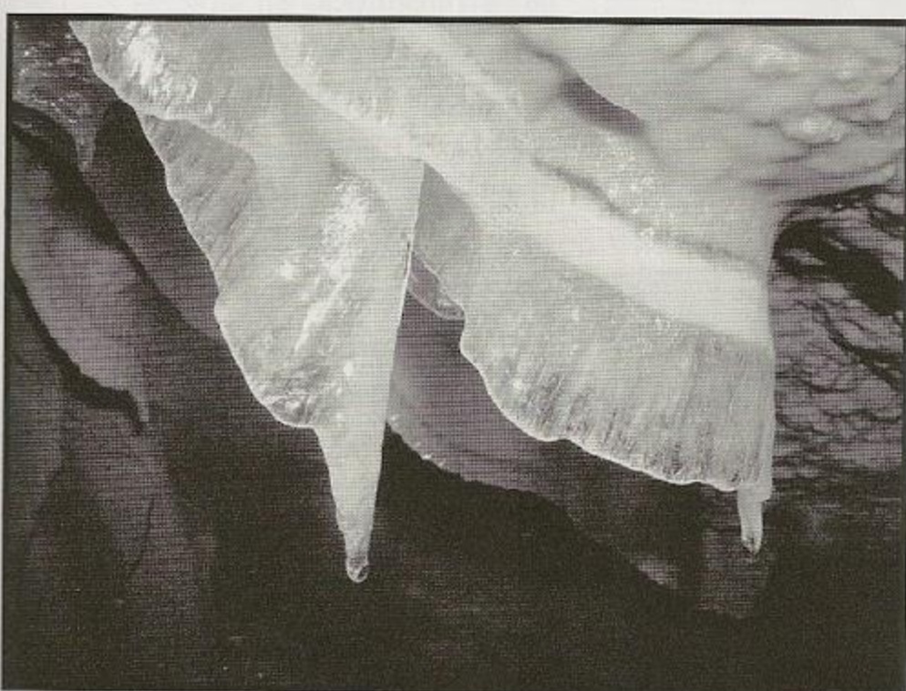
Espeleotema descubierto en la nueva galería de la cueva de túnel (Navajas)

3. La tercera cavidad descubierta es en realidad una galería desconocida en una cavidad conocida en el municipio de Navajas.