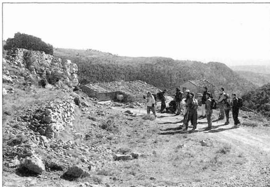
Mas del Collet