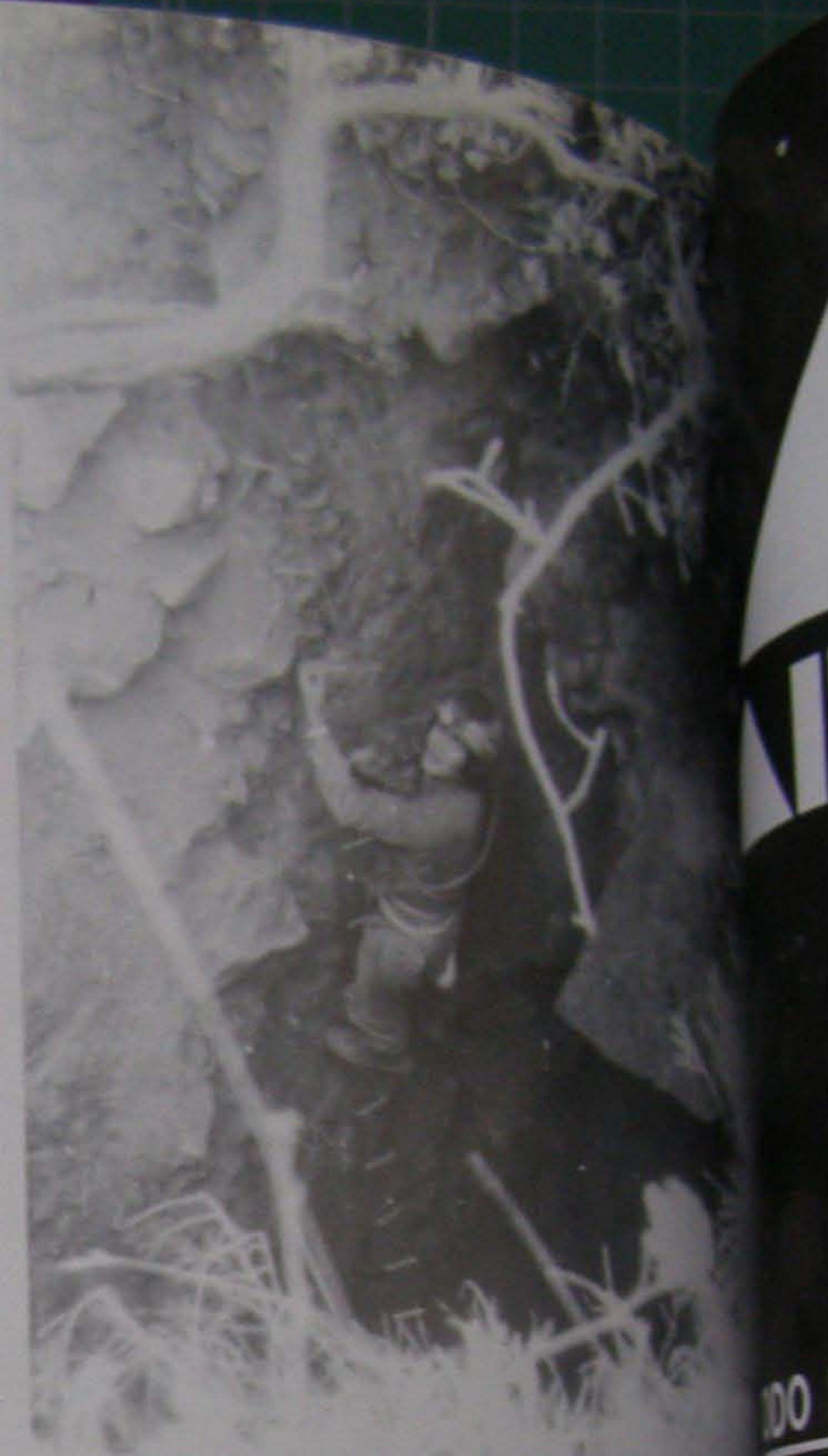
Boca de entrada al Avenc del Turio

(3) Amb les galeries artificials presenta un recorregut de 945 metres.