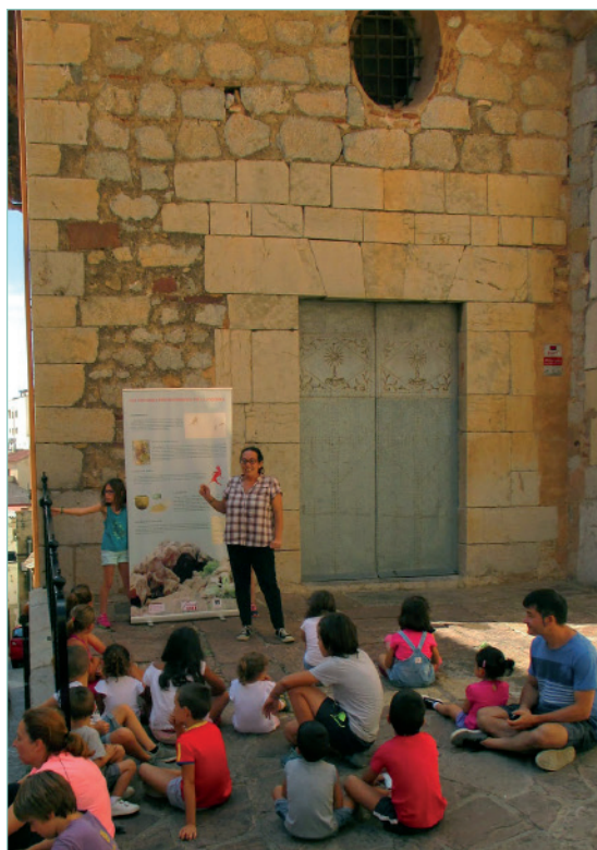
Figura 5. Utilització del roll up com a recurs didàctic en tallers infantils

Joquera i de l'arquer de Borriol, una definició de l'art neolític i la importància de la inclusió de les pintures de la Joquera com a patrimoni de la humanitat (fig. 5). Seguidament, el doctor Rafael Martínez Valle, va ser l'encarregat d'impartir la conferència al saló d'actes titulada "Les pintures rupestres de la Joquera, Borriol 20 anys en la Llista del Patrimoni Mundial, darreres intervencions". En ella les pintures de la Joquera van centrar el discurs del conferenciant, que posà el focus en les intervencions realitzades en les pintures de la Joquera per l'Institut Valencià de Conservació, Restauració i Investigació l'any 2007 (fig. 6). Aquesta actuació en la que es realitzà l'actual tancament per a la protec-