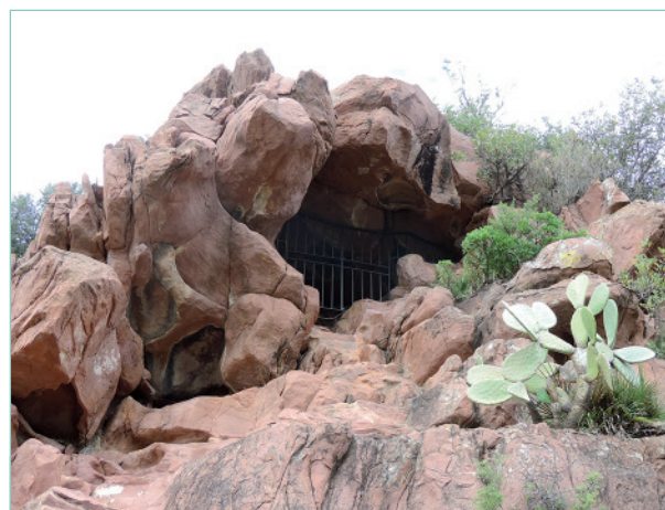
Figura 1. Abric de la Joquera

La balma on es troben les pintures està a 248 metres d'altura sobre el nivell del mar. Està conformada per grans blocs de gres rogenc d'origen trià-