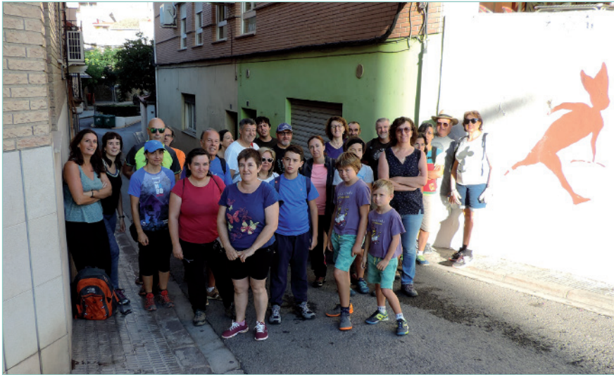
Figura 7. Inici de la visita guiada a les pintures al 2018

ció de les pintures, també incorporà una intervenció directa sobre les pintures que va consistir en l'anàlisi dels suports, el diagnòstic de les patologies que presentaven les pintures i la posterior restauració de les mateixes. Després dels anàlisis petrològics i de caracterització de les pàtines superficials, es va iniciar una actuació de restauració i conservació consistent en la supressió dels grafitis contemporanis i en la consolidació del suport de les pintures. El conferenciant també compartí amb els assistents la informació recuperada gràcies al tractament digital de les fotografies realitzades en dita intervenció, les quals obrin noves interpretacions respecte als elements que l'arquer porta a la mà, a més de permetre identificar noves taques de pintura que deuran ser analitzades amb detall.