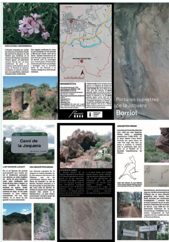
Figura 4. Tríptic de la Joquera

i en la premsa provincial, les Jornades d'Art Rupestre de Borriol es realitzaren el cap de setmana comprès entre el 14 i 16 de juliol de 2017. Començaren la vesprada del divendres 14 de juliol amb la presentació al saló d'actes de l'ajuntament del recurs didàctic generat, el tríptic divulgatiu Pintures rupestres de la Joquera , realitzat amb l'assessorament del doctor en història Josep Cristià Linares Bayo (fig. 4). Tot seguit s'imparti la conferència Les pintures de la Joquera en el context de l'art rupestre europeu a càrrec d'un dels firmants. Finalment el matí del diumenge 16 es realitzà la visita comentada a les pintures amb la que concloueren les jornades.