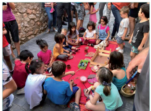
Figura 8. Taller infantil sobre les pintures de la Joquera

Totes elles són activitats patrimonials assumibles econòmicament per qualsevol ajuntament o